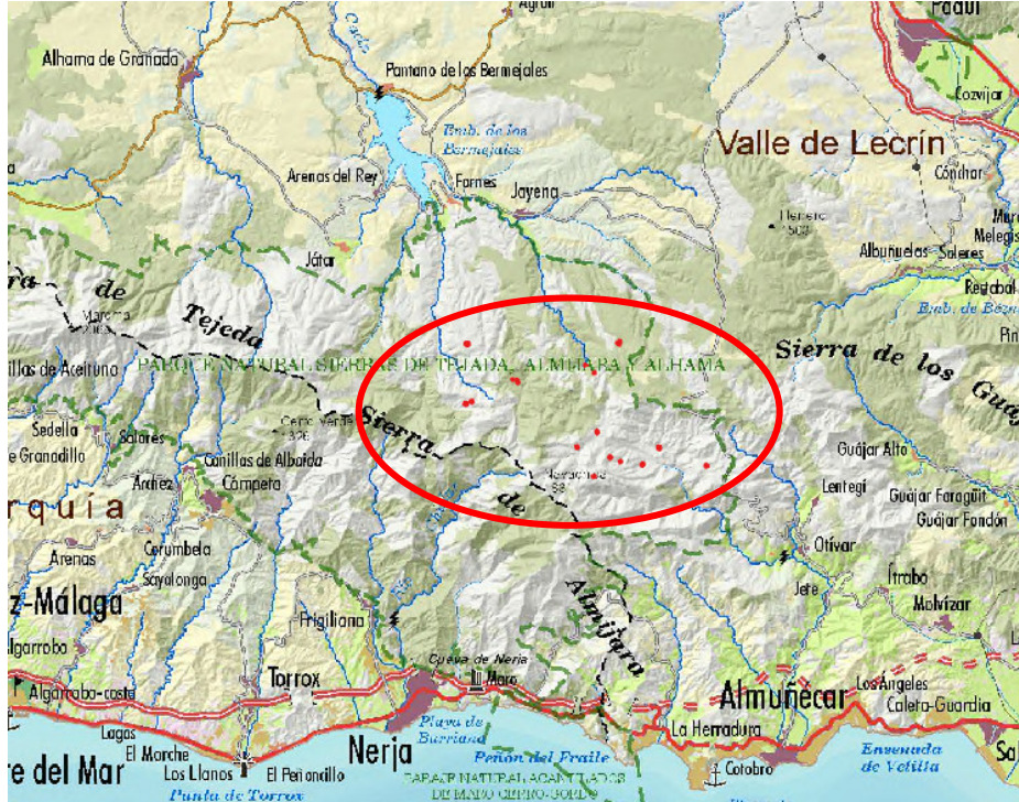
Plano de Localización (1)