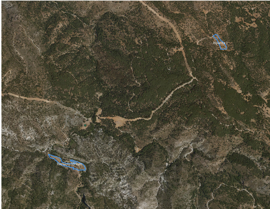
Plano de emplazamiento (3). Monte de Córzola