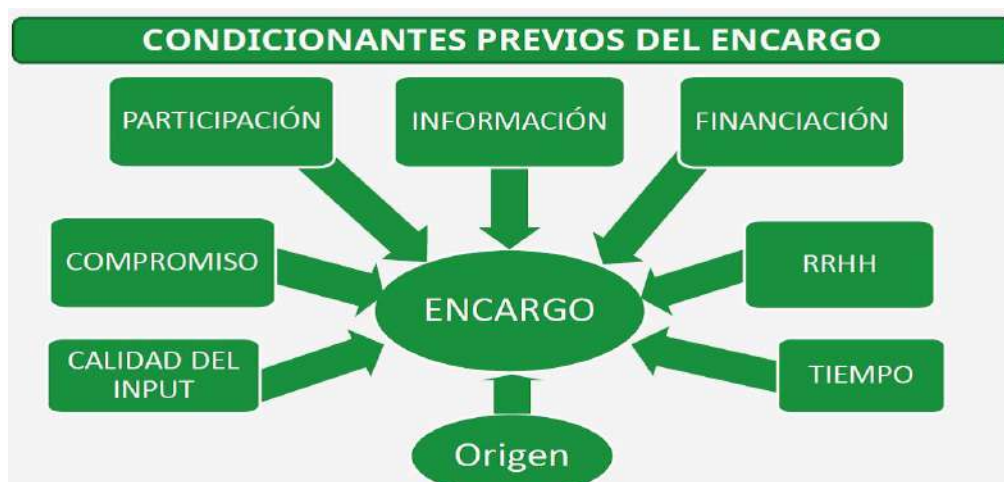
Gráfico 1. Condicionantes previos del encargo de evaluación

× El origen de la evaluación. Se hace necesario conocer el mandato de la evaluación a fin de asegurar la coherencia debida en el caso que alguna norma exija su realización o si el propio objeto de evaluación tiene previsto la realización de evaluaciones, para que los detalles que figuren sobre estas sean tenidos en cuenta e incorporados al encargo.