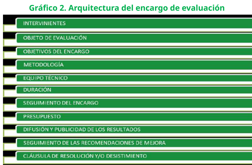
Gráfico 2. Arquitectura del encargo de evaluación

A continuación en el gráfico 2 se presenta una propuesta de contenidos, que dan forma a la arquitectura del encargo.