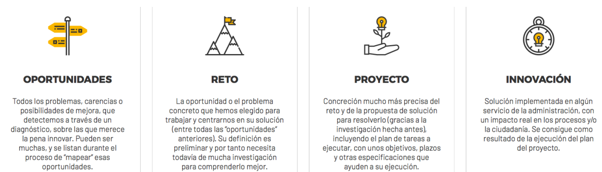
Figura 2. Términos clave del proceso de innovación desarrollado en la InnoGuía.

Cuatro conceptos o términos clave son la base del proceso que consiste en conseguir avanzar desde que se detectan oportunidades o problemas hasta que se consiguen transformar en innovaciones de impacto.