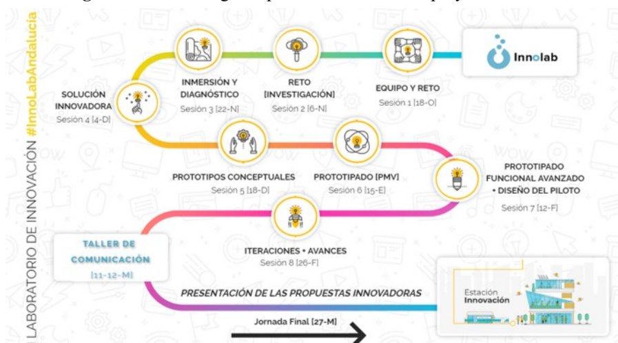
Figura 4. Proceso seguido para la aceleración de proyectos en InnoLab

No se trata de un Laboratorio convencional ni tampoco de un Laboratorio de ciudadanía, ambos centrados en la búsqueda de soluciones especulativas sin presión en los resultados. InnoLab es mas un laboratorio de innovación pública, o también de aprendizaje, que gestiona proyectos donde existe presión en obtener resultados relevantes para la institución que estimulen a un número mayor de personas a innovar. El objetivo principal es aprender a diseñar soluciones a problemas trabajando colaborativamente con la ciudadanía para liberar la inteligencia colectiva. Lo explicamos en el I Foro Iberoamericano de CPI e Innovación.