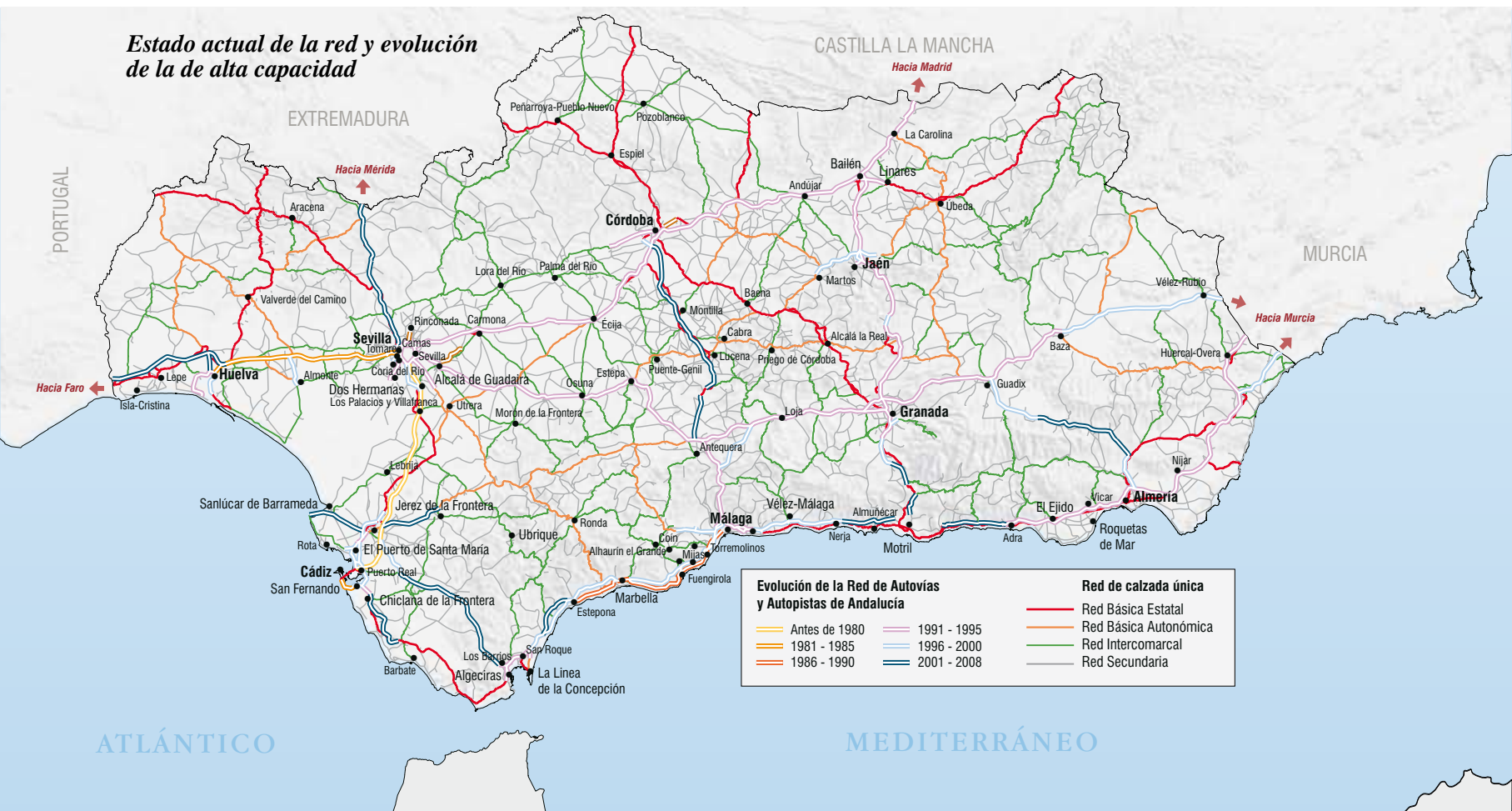
Estado actual de la red y evolución de la de alta capacidad

Las carreteras se reafirman como el soporte preferente para los transportes terrestres, lo que fuera el ferrocarril en lo inicios del siglo anterior.