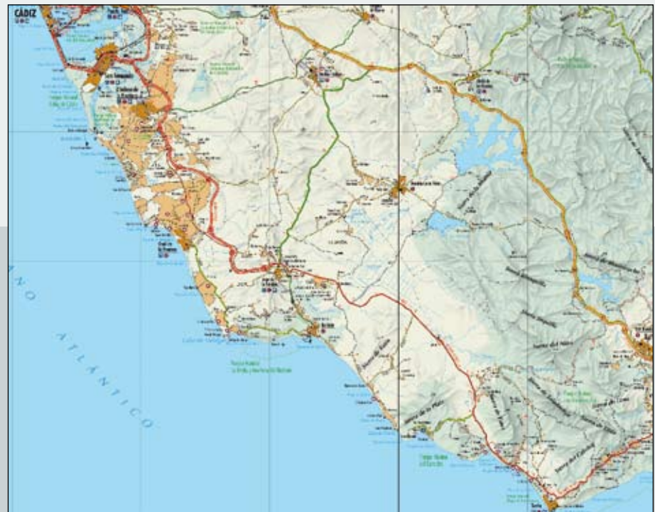
Detalles de la Guía de Carreteras de Andalucía . Junta de Andalucía, 2008.