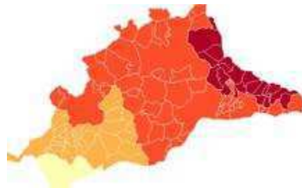
Mapa de peligrosidad sísmica de la provincia de Málaga por municipios (Diputación Provincial de Málaga)

Es preciso tener en consideración la sismicidad, esto es, la frecuencia de sismos por unidad de área en una región determinada, y por otra parte, la capacidad de daño o el efecto que sobre las construcciones humanas producen los movimientos del suelo originados por los terremotos, que en cada punto dependerá tanto del movimiento como de la respuesta de las construcciones. La distribución de la capacidad de daño en el espacio y en el tiempo es el riesgo sísmico.