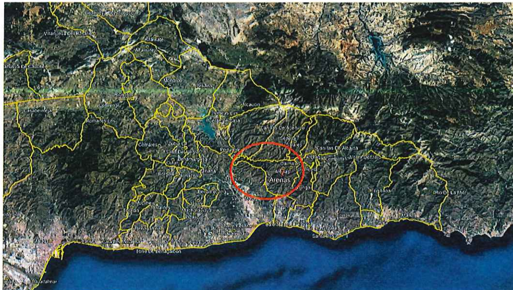
1. Ilustración: Situación

Expediente: Evaluación Ambiental Estratégica Peticionario : Servicio de Protección Ambiental Promotor: Fecha Reg. Entrada: 11-09-2019 Registro: Municipio Arenas Provincia: Málaga Lugar o Paraje: Todo el municipio Coords. UTM: Datum: ETRS89 Huso: 30 X: 406816 Y: 4074929 Cauce: Margen: