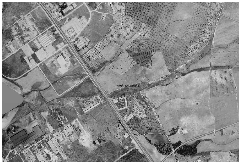
Ortofoto año 1977