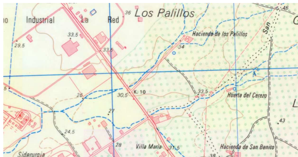
Primera edición del MTN25

Según se comprueba en diversa cartografía y ortofotografía histórica, en el ámbito del sector SUO-4 'SUP-i5 Los Palillos' del PGOU de Alcalá de Guadaíra, existía un cauce denominado arroyo San Benito, y del que se desconoce la situación actual a causa de las obras de urbanización ejecutadas.