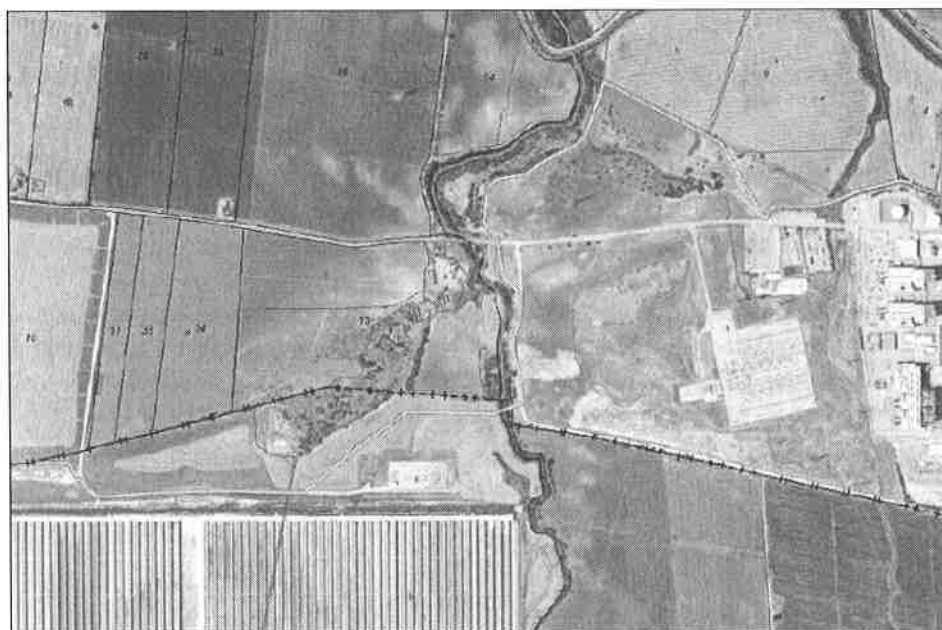
Emplazamiento del proyecto (trazado amarillo) sobre ortofoto y cartografía catastral.

El ramal para suministro a las Plantas Termosolares partirá desde la futura ampliación de la posición K-11.10 de Enegas existente junto a la Central de Ciclo Combinado de Iberdrola en Arcos de la Frontera (Cádiz). Discurrirá en zanja por un camino asfaltado de acceso a dicha Central de Ciclo Combinado hasta la zona de parking, en cuyo punto se desviará dirección noroeste por un camino de tierra y discurrirá por el límite de la parcela y paralela al Arroyo de la Molineta, hasta alcanzar un camino existente de tierra, previamente a este punto se cruzará el camino asfaltado de acceso a la Central de Ciclo Combinado.