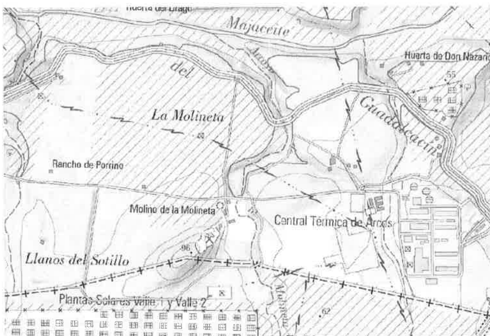
Situación del proyecto (trazado amarillo) sobre topográfico.

El ramal para suministro a las Plantas Termosolares partirá desde la futura ampliación de la posición K-11.10 de Enegas existente junto a la Central de Ciclo Combinado de Iberdrola en Arcos de la Frontera (Cádiz). Discurrirá en zanja por un camino asfaltado de acceso a dicha Central de Ciclo Combinado hasta la zona de parking, en cuyo punto se desviará dirección noroeste por un camino de tierra y discurrirá por el límite de la parcela y paralela al Arroyo de la Molineta, hasta alcanzar un camino existente de tierra, previamente a este punto se cruzará el camino asfaltado de acceso a la Central de Ciclo Combinado.