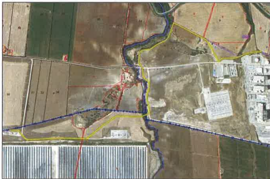
Emplazamiento del proyecto (trazado amarillo) sobre ortofoto y cartografía catastral.

Una vez en el camino de tierra paralelo al mencionado arroyo y en dirección sur discurrirá manteniéndose, siempre que sea posible, por el lado del camino más alejado del arroyo y continuará por dicho camino unos 224 metros, para virar en dirección oeste y cruzar el Arroyo de La Molineta mediante perforación horizontal y abandonar el término municipal de Arcos de La Frontera entrando en el de San José del Valle. Tras el cruce del arroyo, la canalización discurrirá campo a través por fincas particulares paralelo a las Plantas Termosolares existentes hasta alcanzar el camino de acceso a dicha Planta por el que discurrirá hasta llegar al punto donde se realizará el suministro a dichas plantas (2 acometidas DN-3"). La longitud total del ramal será de 2.682 metros aproximadamente, discurriendo unos 1.616 dentro del término municipal de Arcos de La Frontera y unos 1.066 metros por el término municipal de San José del Valle.