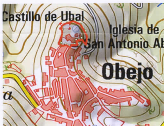
*ámbito del sector aproximado.