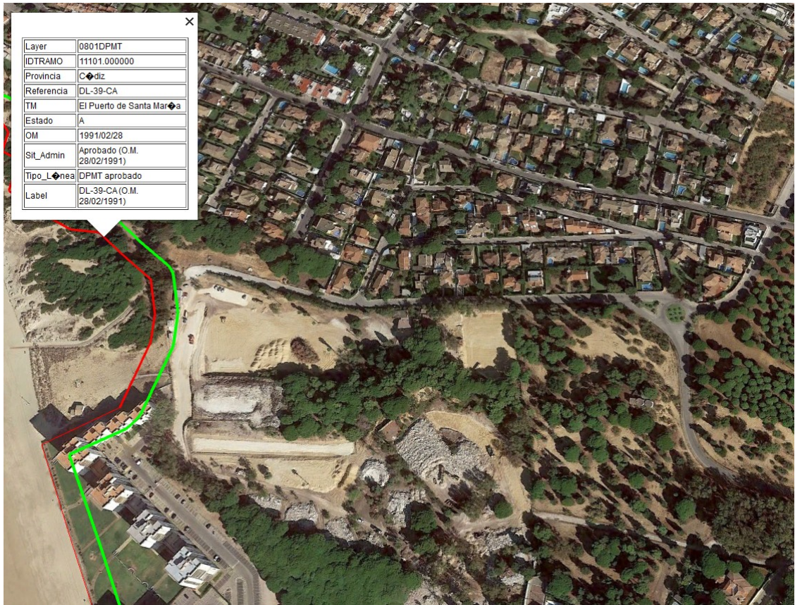
Figura 2: Línea roja, límite del dominio público marítimo terrestre. Línea verde límite de la zona de servidumbre de protección.

III. Como se puede apreciar en la figura nº1, la Modificación Puntual propuesta no afecta directamente a la zona de dominio público marítimo terrestre, ni a sus servidumbres, pero se tiene que tener en cuenta que el sistema viario propuesto en la alternativa presentada, conecta a otra unidad de ejecución tramitada como "Modificación Puntual de Ordenación Pormenorizada del PGOU de 1992 de el Puerto de Santa María, en Club Mediterráneo", que si es colindante con la servidumbre de protección del dominio público marítimo terrestre, deslinda C-DL-39-CA, con publicación en Orden Ministerial de 28 de febrero de 1991, entre los hitos M13 al M17.