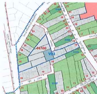
PROPUESTA FICHA V03