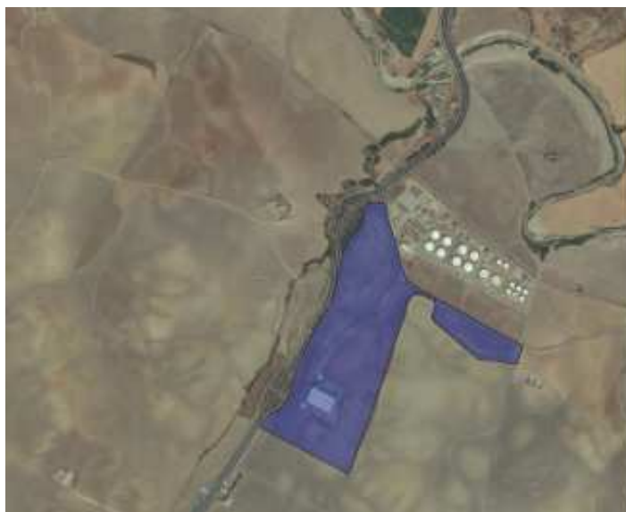
Figura 1: Marcado en azul el ámbito de actuación propuesto

El ámbito de esta innovación se sitúa en el punto kilométrico 412 de la autovía A-4 en su margen derecha en dirección a Madrid, justo al sur del Centro Logístico de Hidrocarburos y frente al aprobado Polígono de Actividades Territoriales “El Álamo” de quien lo separa la citada autovía.