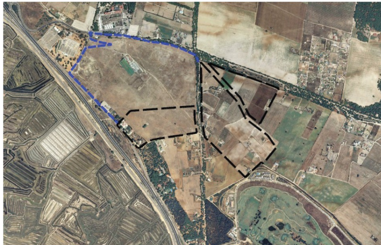
- - - - - ÁMBITO DE SECTORIZACIÓN. SUNS Sup: 457.730,00 m 2 - - - - - ÁMBITO DE INNOVACIÓN. SNU Sup: 434.515,00 m 2

El área afectada, según la documentación estudiada, forma parte de varias fincas, todas ellas adscritas, según el planeamiento urbanístico vigente en el municipio, al suelo urbanizable no sectorizado. Asimismo, figuran como parcelas afectadas otras tantas para la ejecución de sistemas generales adscritos necesarios para la operatividad del nuevo ámbito sectorizado, estas últimas se encuentran ubicadas en la periferia del suelo sectorizable y actualmente están clasificadas como suelo no urbanizable.