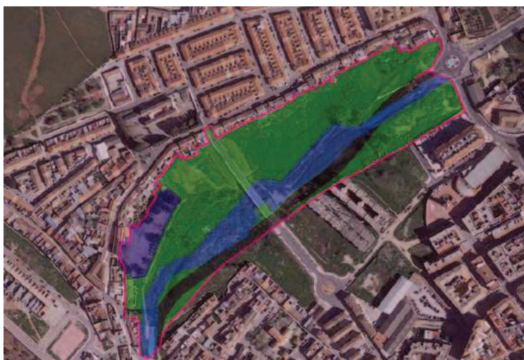
La línea violeta representa el ámbito de la innovación y en su interior el SGV-A2 en verde, el SGC y el viario local en gris, el equipamiento docente privado en azul oscuro y el SNUEP-LE en azul claro.

Alternativa 2: En esta alternativa, para alcanzar los objetivos previstos se propone mantener en parte el sistema general de comunicaciones de la vaguada sur, hasta que se corta con el mismo trazado previsto en la alternativa 1 anterior. Esta alternativa no altera la delimitación determinada para esta innovación del dominio público hidráulico y sus zonas de servidumbre.