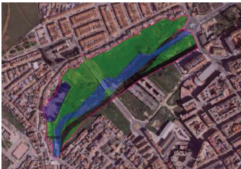
La línea violeta representa el ámbito de la innovación y en su interior el SGV-A2 en verde, el SGC y el viario local en gris, el equipamiento docente privado en azul oscuro y el SNUEP-LE en azul claro.

Alternativa 3: En esta alternativa, para alcanzar los objetivos previstos se propone mantener el esquema del doble corredor del SGC previsto en el PGOU pero realizando un cambio de trazado hacia el sur del vial localizado al norte del Periquito Melchor que evite grandes movimientos de tierra y estructuras de contención, adaptando su trazado a la topografía existente. Para ello, partiendo de la rotonda ya ejecutada en la Carretera de Baños de la Encina se dirige el viario hacia el ojo del puente que comunica la calle Labrador con la avenida