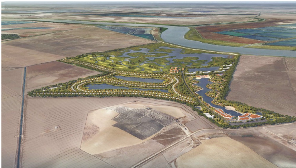
Recreación de la Actuación.