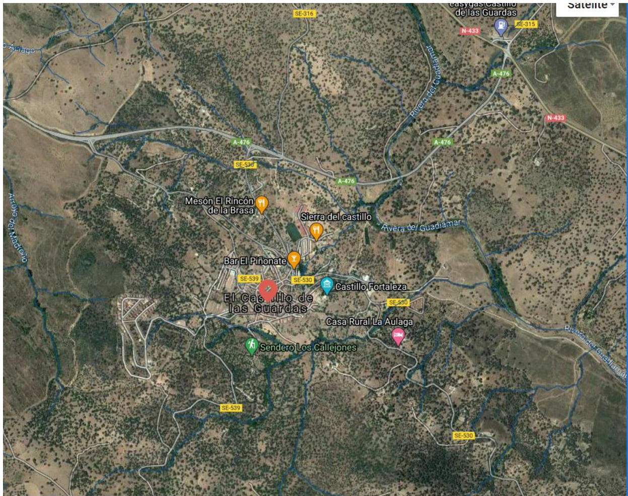
Red Hidrográfica en el entorno del núcleo de Castillo de las Guardas

Hay que señalar que, en zona de flujo preferente en suelos en situación básica de suelo rural (art. 9 bis) se establece que no se permitirán: