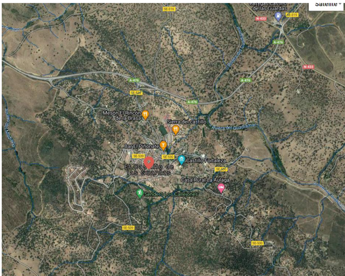
Red Hidrográfica en el entorno del núcleo de Castillo de las Guardas

Hay que señalar que, en zona de flujo preferente en suelos en situación básica de suelo rural (art. 9 bis) se establece que no se permitirán: