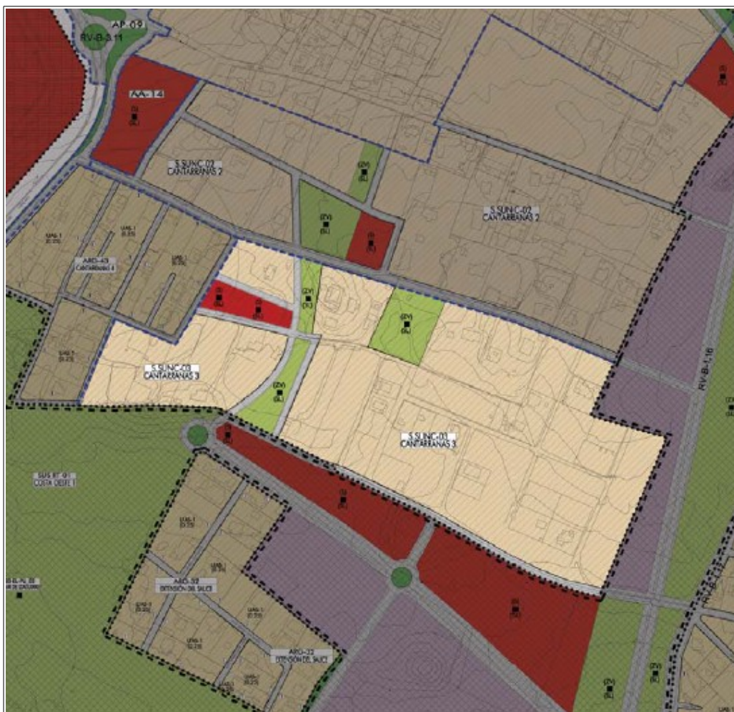
Ordenación SUNC-03 Cantarranas 3