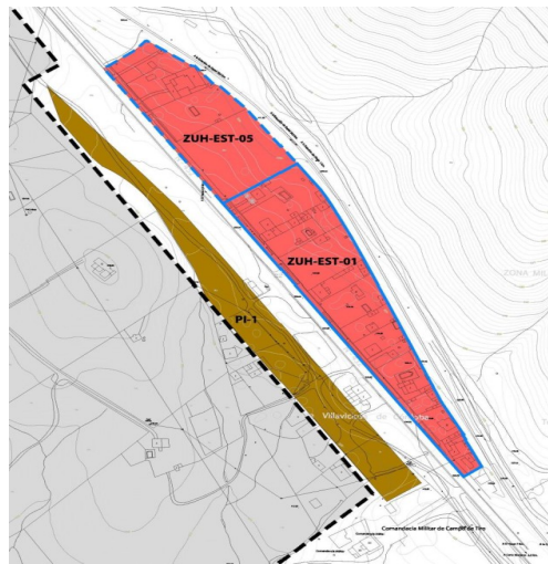
Figura 1. Alternativa UNO escogida