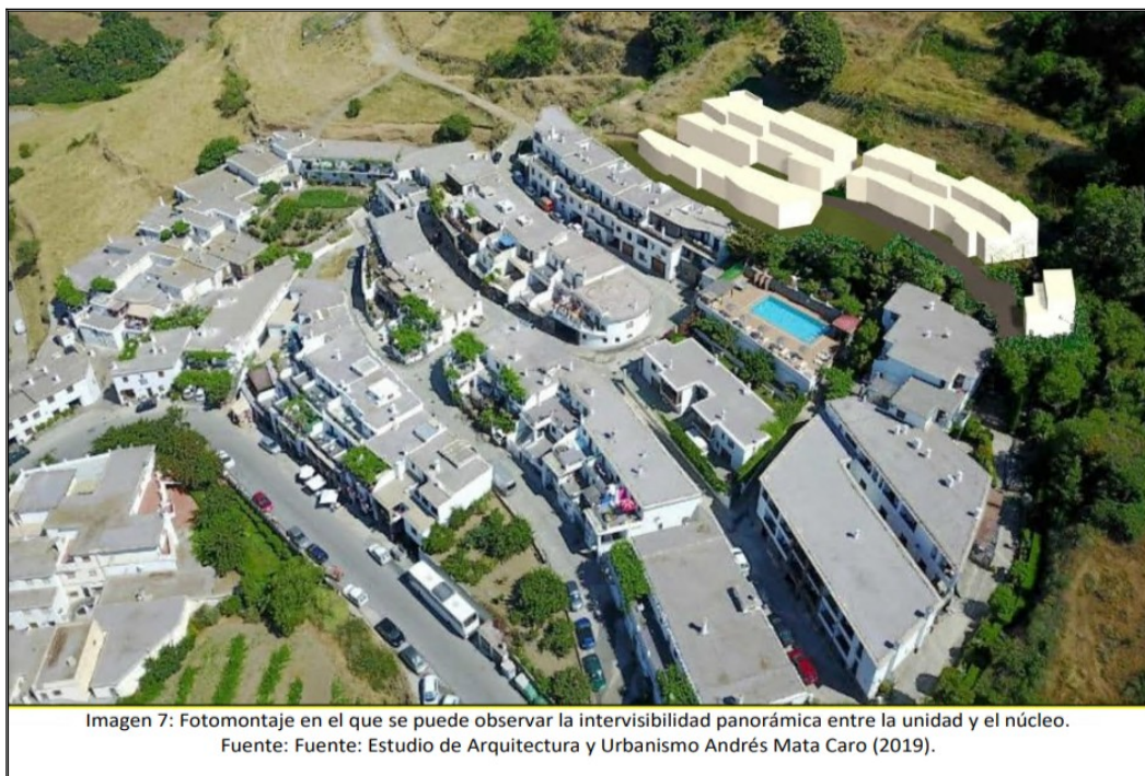
Imagen 7: Fotomontaje en el que se puede observar la intervisibilidad panorámica entre la unidad y el núcleo.