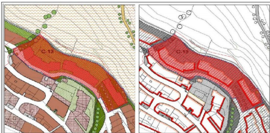
Imagen 2: La ordenación propuesta en las NN.SS. del Barranco del Poqueira.

Acorde al informe del Servicio de Urbanismo, la propuesta modifica el viario y la configuración de los espacios libres considerados de localización obligatoria en la Ficha de planeamiento; si bien debe tenerse en cuenta la Instrucción 4/2019, de la Dirección General de Ordenación del Territorio y Urbanismo, sobre la incorporación en el planeamiento general de determinaciones pertenecientes a la ordenación detallada, según la cual el planeamiento general no debe incorporar ninguna de las determinaciones que, según la LOUA, correspondan a la ordenación detallada ni siquiera a título indicativo o no vinculante, debiendo limitarse a establecer en relación a la citada ordenación detallada, según proceda, los objetivos, criterios y directrices que permitan establecerla, de conformidad con lo dispuesto en el artículo 10.2.A de la LOUA.4