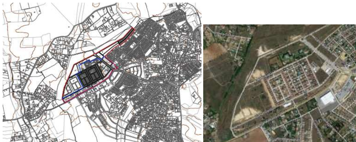
Ámbito del PP-8

De estas 686 viviendas, descontando las manzanas ya edificadas y las que no se alteran sus parámetros, 431, se reordenan los 355 restantes.