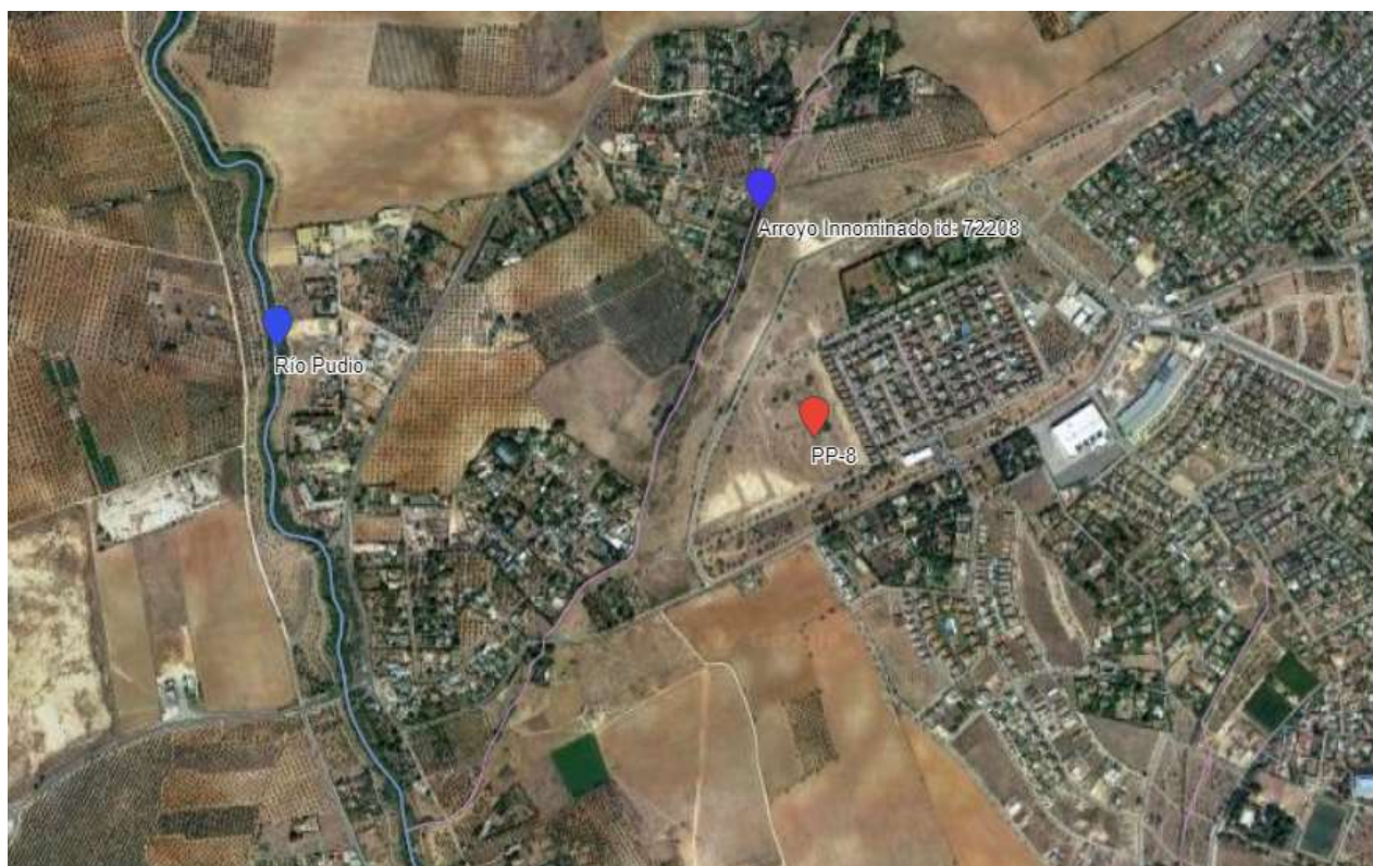
Red Hidrográfica (IDE-Guadalquivir - https://idechg.chguadalquivir.es/ ).

En relación a la afección a las aguas subterráneas, se informa que: La zona se encuentra sobre la masa de agua subterránea ES050MSBT000055001 "Aljarafe Norte". Se encuentra en mal estado cuantitativo y en mal estado químico, siendo su estado global Malo.