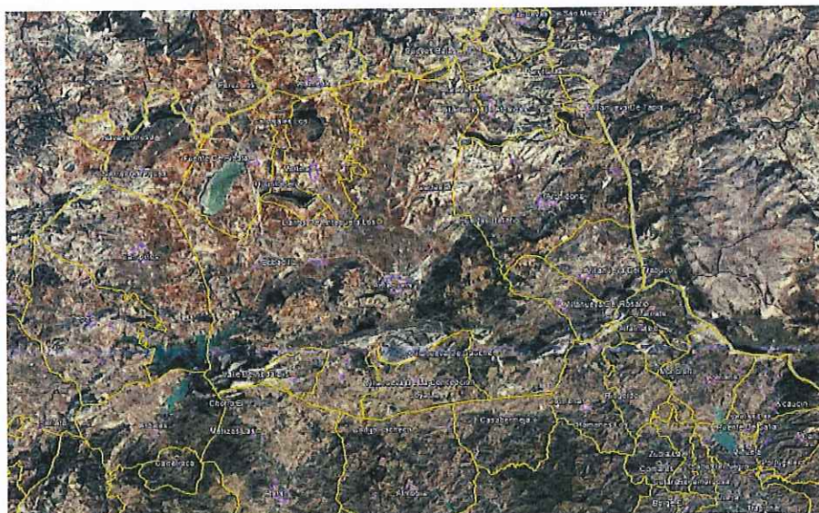
Ilustración 1: Situación

Con fecha 20 de diciembre de 2018 se recibe nota del Servicio de Protección Ambiental trasladando solicitud de inicio de Evaluación Ambiental Estratégica Simplificada de "La Innovación del PGOU de Antequera mediante la modificación del artículo 8.2.5 y del punto B del artículo 8.2.8 del tomo III de normativa urbanística" requiriendo de esta Administración informe sobre los aspectos de su competencia,