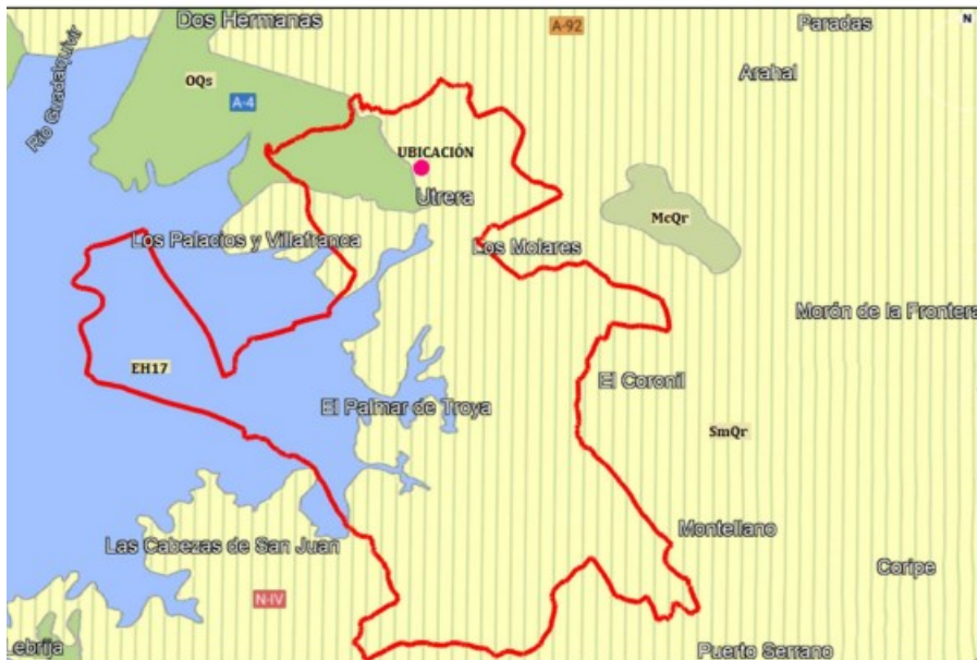
Imagen 18. Vegetación potencial del término municipal de Utrera.

Concretamente, la localización de la presente modificación la podemos ubicar sobre el código SmQr.