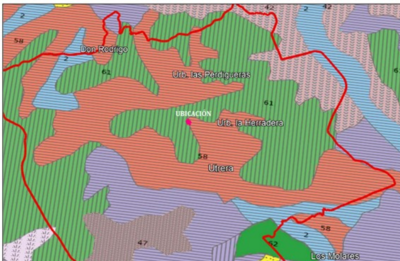
Imagen 11. Suelos de la zona del Estudio en el Sector SUO-6 "Innovatormo", Utrera.