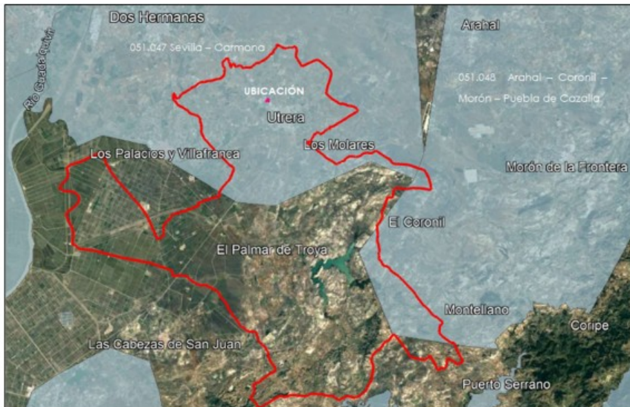
Imagen 17. Masas de aguas subterráneas dentro del término municipal de Utrera, Sevilla