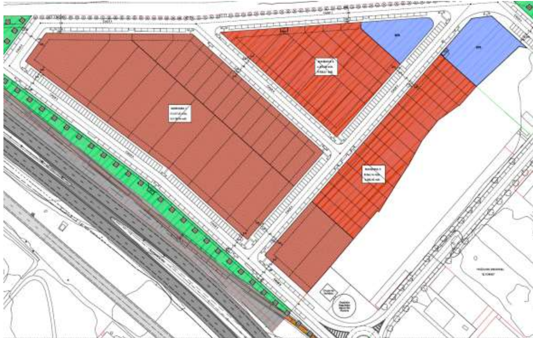
CUADRO DE APROVECHAMIENTOS