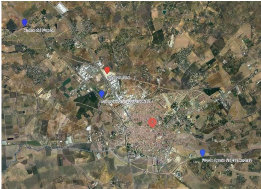
Hidrográfica (IDE-Guadalquivir - https://idechg.chguadalquivir.es/ ).

En relación a la afección a las aguas subterráneas, se informa que la zona se ubica la masa de agua subterránea ES050MSBT000054700 “Sevilla – Carmona”. Se encuentra en mal estado cuantitativo y en mal estado químico, siendo su estado global Malo