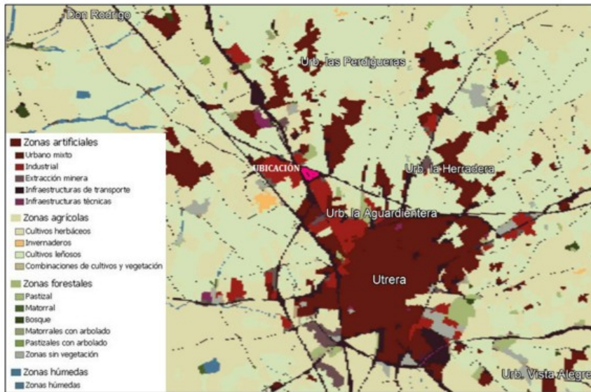
Imagen 13. Usos del suelo en la zona de estudio.

En el ámbito del estudio, nos encontramos sobre zonas artificiales, concretamente sobre zonas artificiales industriales y de infraestructuras de transporte, rodeadas de algunas zonas de carácter agrícola destacando los cultivos leñosos.