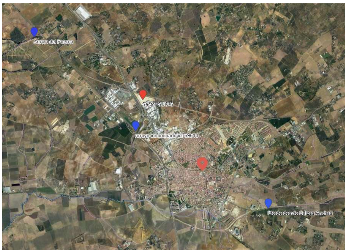
Hidrográfica (IDE-Guadalquivir - https://idechg.chguadalquivir.es/ ).

En relación a la afección a las aguas subterráneas, se informa que la zona se ubica la masa de agua subterránea ES050MSBT000054700 "Sevilla – Carmona". Se encuentra en mal estado cuantitativo y en mal estado químico, siendo su estado global Malo.