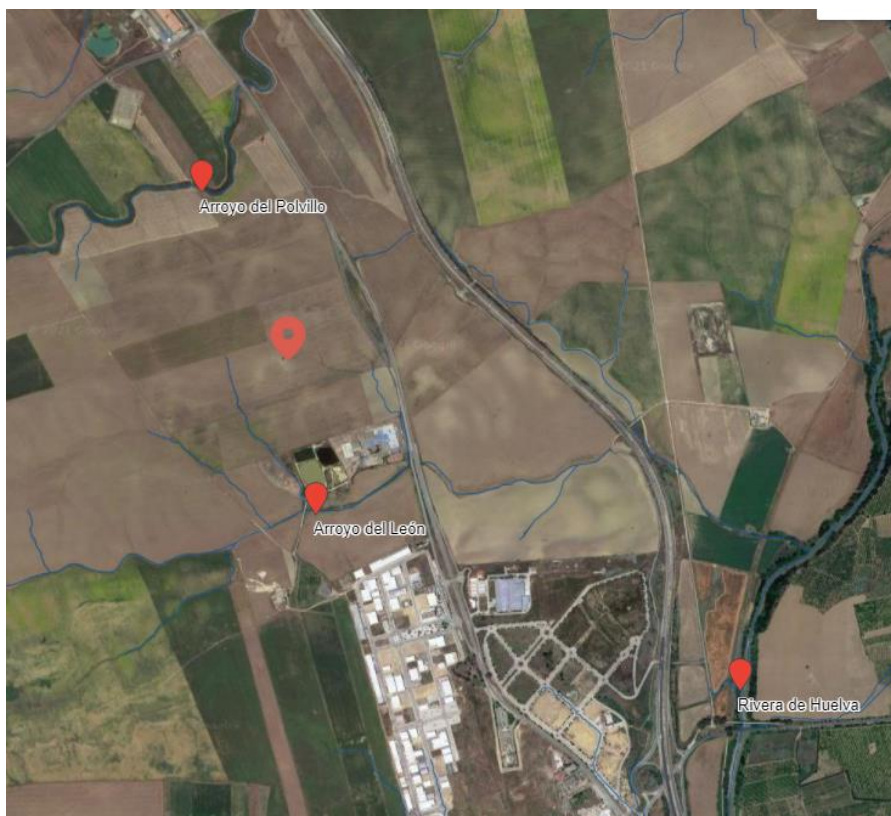
Red Hidrográfica (IDE-Guadalquivir - https://idechg.chguadalquivir.es/ ).

Así mismo se deberán integrar en el planeamiento con los usos que corresponda las zonas de inundación de acuerdo con lo previsto en el Reglamento del Dominio Público hidráulico aprobado por Real Decreto 638/2016 de 9 de Diciembre". También se indica que las zonas inundables se integran como zonas de espacios libres.