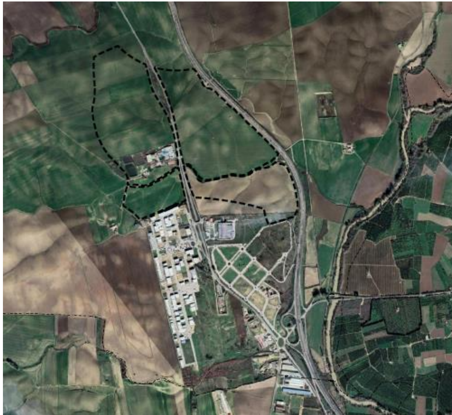
Localización del ámbito de la revisión del Planeamiento.

Esta previsto la creación de una zona de espacios libres en las zonas inundables del cauce, arroyo de León, que atraviesa la zona. Dejando el DPH fuera de la ordenación.