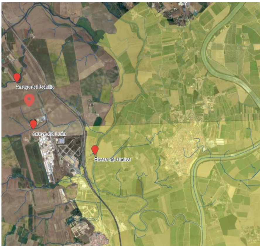
Lamina de inundación para T500 años extraída del SNCZI del MITERD

Consultando la cartografía de zonas inundables realizadas dentro de los trabajos del Sistema Nacional de Cartografía de Zonas Inundables (SNCZI) realizados por el MITERD, para el cumplimiento de la directiva de zonas inundables y su desarrollo en el Real Decreto 903/2010, de 9 de julio, de evaluación y gestión de riesgos de inundación, se comprueba que la zona no es inundable por la avenida del río Guadalquivir y del Rivera de Huelva en su tramo final.