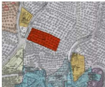
Plano 3. situación del SG de Comunicaciones e Infraestructuras.

También ubicados al norte del núcleo, aunque algo más alejado. Su topografía también es pronunciada, existiendo en uno de sus linderos un acceso a la parcela para vehículos. Según lo dispuesto en las Plan General de Ordenación Urbanística de Zuheros, plano nº 0.3-1, se encuentra situado en terrenos calificados como Suelo No Urbanizable de Carácter Rural: Prevención Cautelar. Quedaría clasificado como SG-CI DOTACIONAL EN SUELO NO URBANIZABLE .