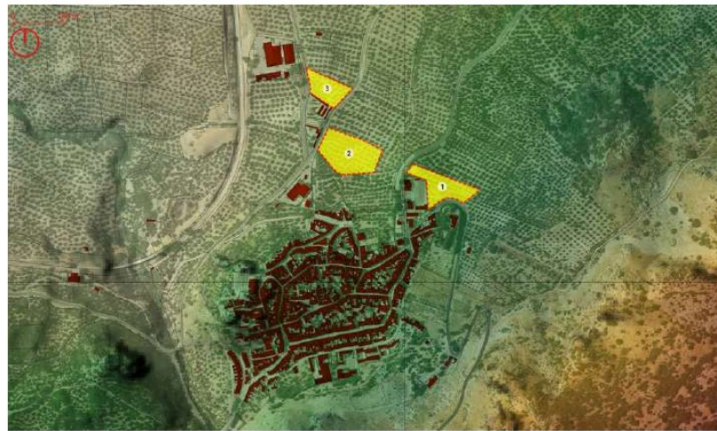
Plano 1. Alternativas estudiadas para la selección del ámbito de actuación.

Por otra parte, se reduce la superficie del equipamiento en la Zona de Regulación Común del Parque Natural, con un ámbito contiguo con la linde norte del C.E.I.P. que permitiría su ampliación hasta la carretera CO-6210.