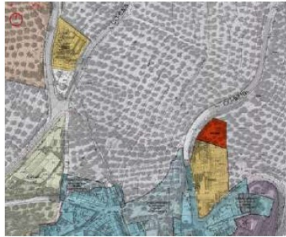
Plano 2. situación del SG equipamiento.

Se encuentra al norte del núcleo urbano, con forma regular y una topografía pronunciada. Como ampliación del SGEQ contaría con acceso a través del espacio peatonal habilitado entre la carretera y el lindero oeste del colegio, y también desde el propio equipamiento existente: C.E.I.P. Ntra. Señora de los Remedios ubicado en su linde sur. Por su orografía no parece conveniente plantear accesos rodados desde la carretera CO-6210.