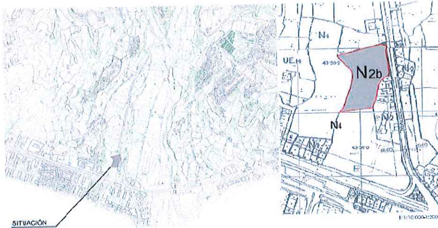
Parcela sobre la que se solicita la modificación.

Se localiza en el Sur del municipio en Torrox Costa, a unos 350 m. de Dominio público Marítimo Terrestre. Por sus inmediaciones pasa la carretera de Torrox A-7207, a 100 m. se encuentra la Carretera nacional N-340 y se encuentra en el límite con suelo No Urbanizable.