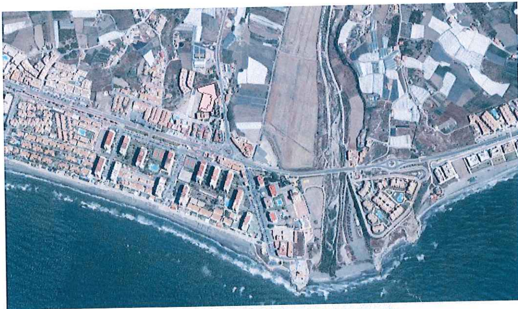
Ámbito de actuación de la caracterización del medio.