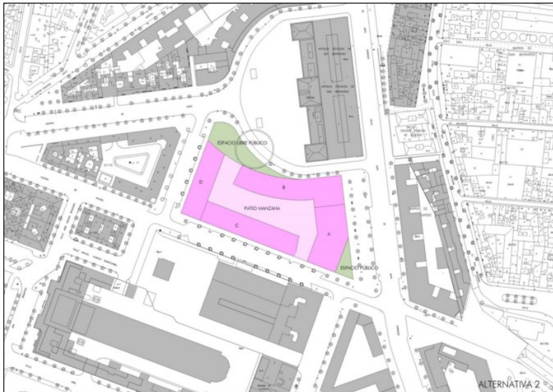
Imagen 4/02 – Alternativa DOS [Parcela San Bernardo con volumetría uniforme completa]

En este caso no se puedan incorporar en la misma parcela de San Bernardo todas las nuevas dotaciones de espacios libres y equipamientos necesarios para mantener los niveles dotacionales existentes en la zona urbana homogénea donde se localiza.