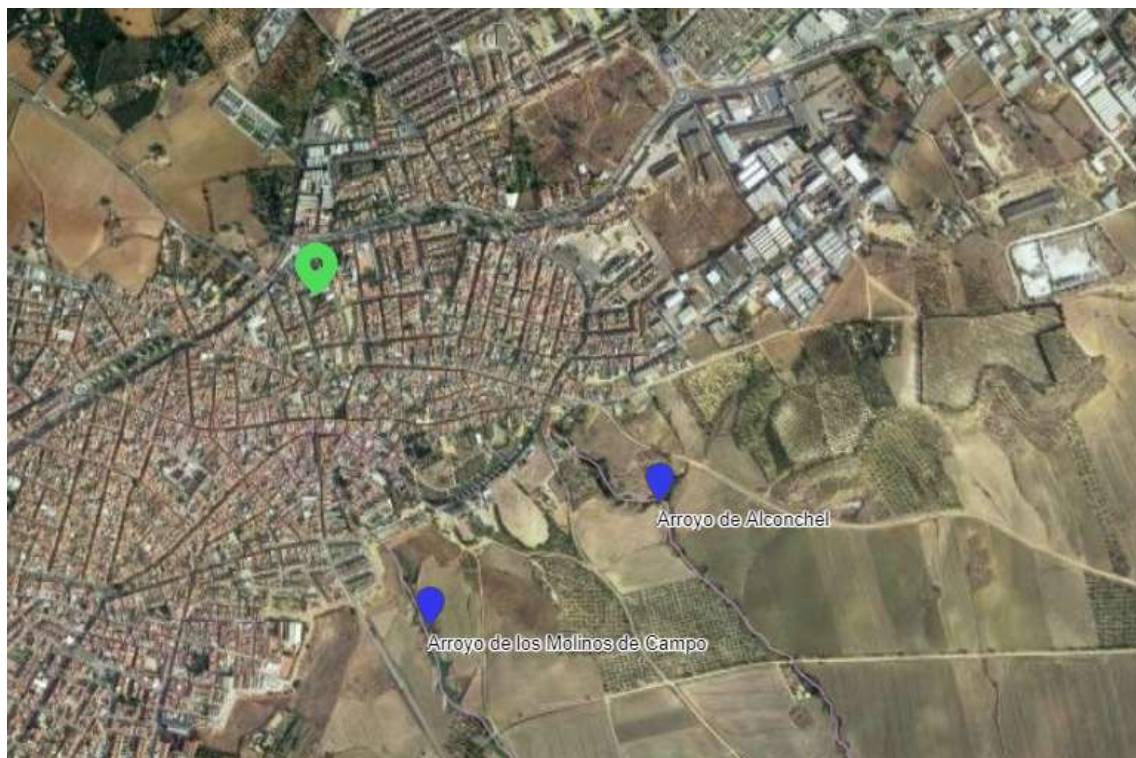
Red Hidrográfica (IDE-Guadalquivir - https://idechg.chguadalquivir.es/ ).

Consultando la cartografía de zonas inundables realizadas dentro de los trabajos del Sistema Nacional de Cartografía de Zonas Inundables (SNCZI) realizados por el MITERD, para el cumplimiento de la directiva de zonas inundables y su desarrollo en el Real Decreto 903/2010, de 9 de julio, de evaluación y gestión de riesgos de inundación, se comprueba que la zona no ha sido estudiada dentro de estos trabajos.