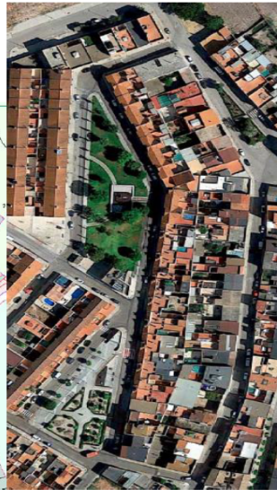
Ámbito Objeto cuarto - Plano de Ordenación. Ámbito de la Zona V de Calificación