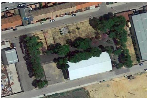
Ámbito Objeto tercero - Normas Urbanísticas. Usos en Recinto Ferial.