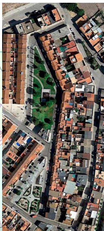
Ámbito Objeto cuarto - Plano de Ordenación. Ámbito de la Zona V de Calificación