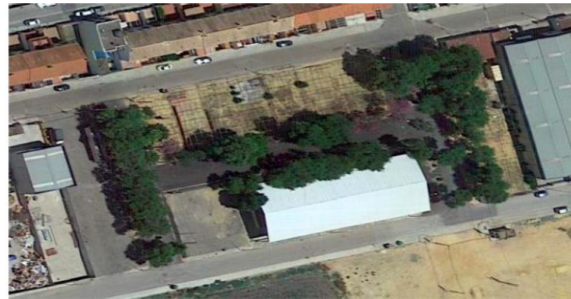
Ámbito Objeto tercero - Normas Urbanísticas. Usos en Recinto Ferial.