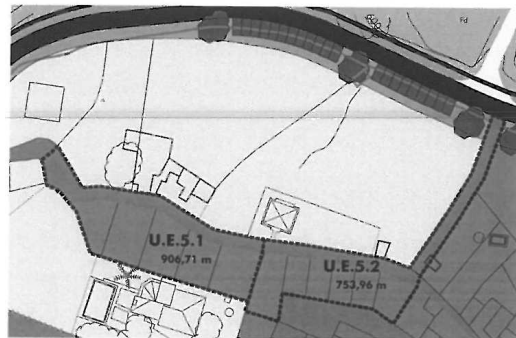
ESTADO PROPUUESTO POR LA MODIFICACIÓN

Respecto al análisis de alternativas aportado, dada la escasa envergadura de la modificación urbanística, el promotor aporta las