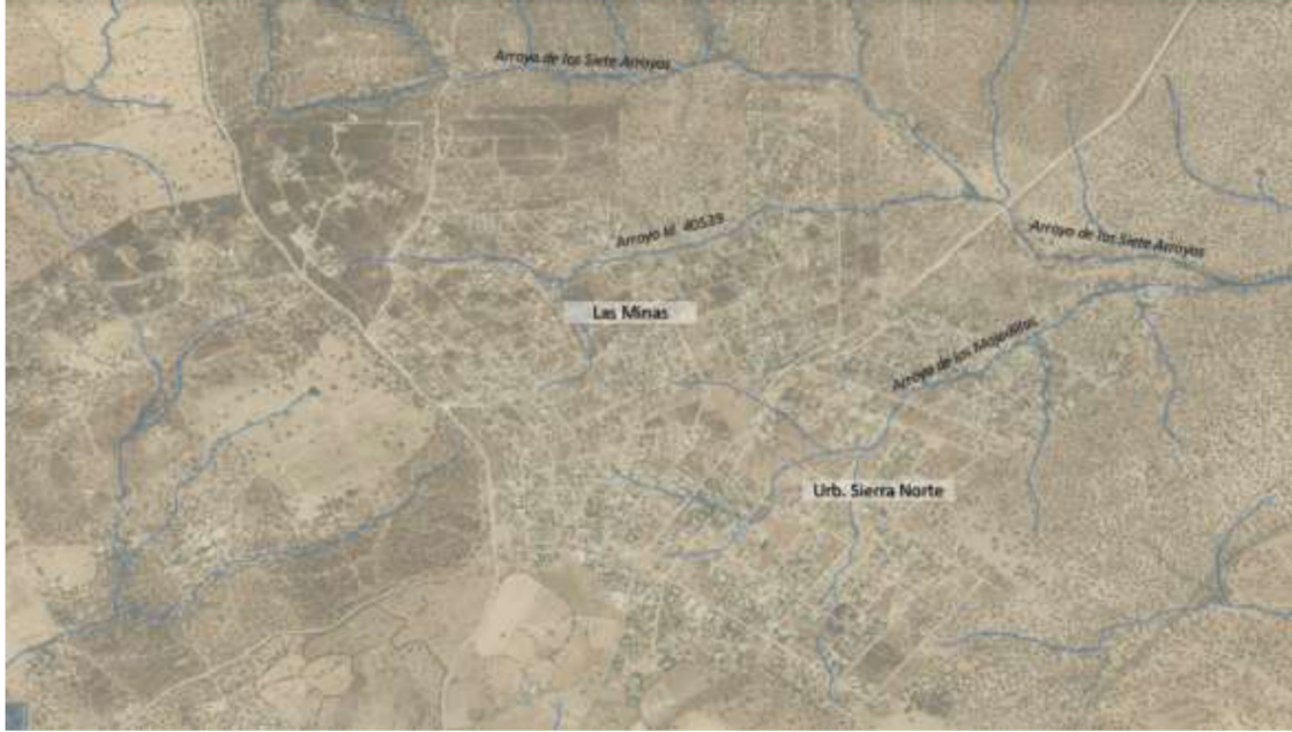
Red hidrográfica en el entorno de la urbanización Sierra Norte y Las Minas