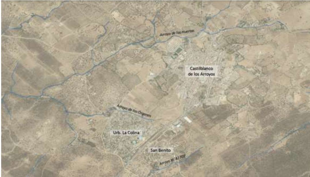
Red hidrográfica en el entorno del núcleo urbano de Castilblanco de los Arroyos, la urbanización La Colina y San Benito

Se informa que la red hidrográfica puede descargarse en formato SHAPE en el apartado “descargas” de la web de la Infraestructura de Datos Espaciales (IDE) de este Organismo de cuenca ( https://idechg.chguadalquivir.es/nodo/verdescargas.do?capa=RED_HIDROGRAFICA_1 ).