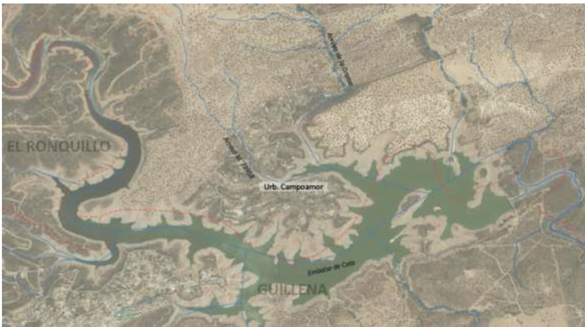
Red hidrográfica en el entorno de la urbanización Campoamor

Los principales embalses localizados en el término municipal de Castilblanco de los Arroyos son los