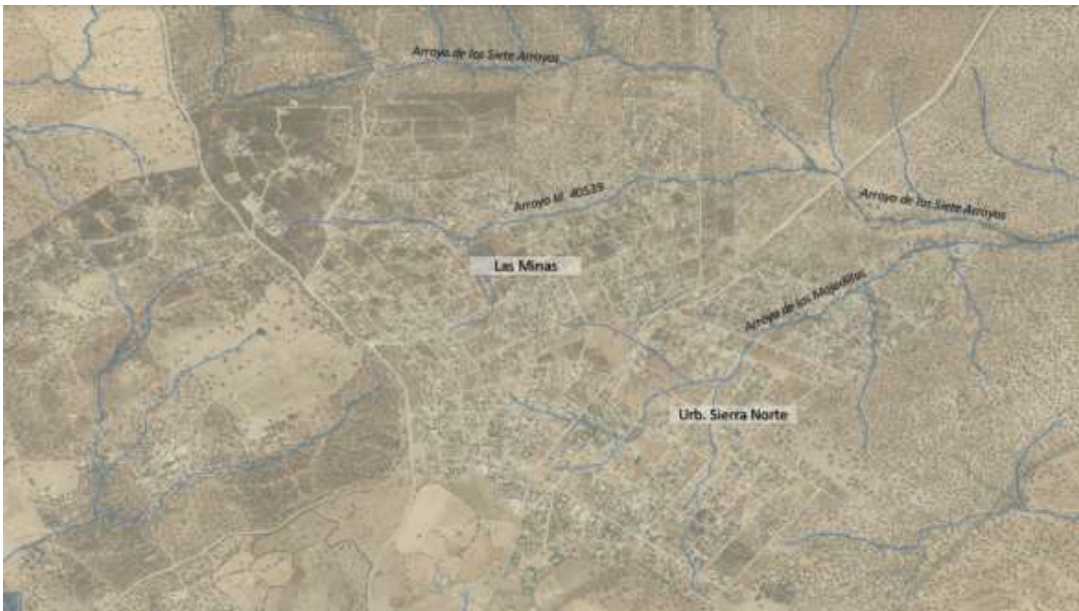
Red hidrográfica en el entorno de la urbanización Sierra Norte y Las Minas