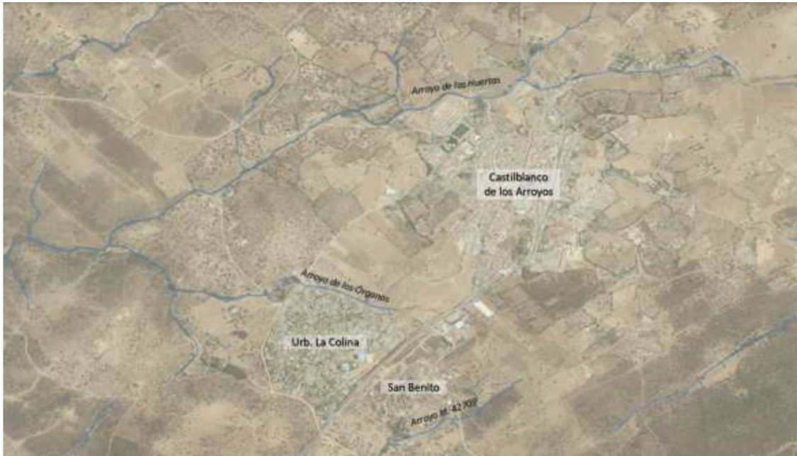
Red hidrográfica en el entorno del núcleo urbano de Castilblanco de los Arroyos, la urbanización La Colina y San Benito

( https://idechg.chguadalquivir.es/nodo/verdescargas.do?capa=RED_HIDROGRAFICA_1 ).