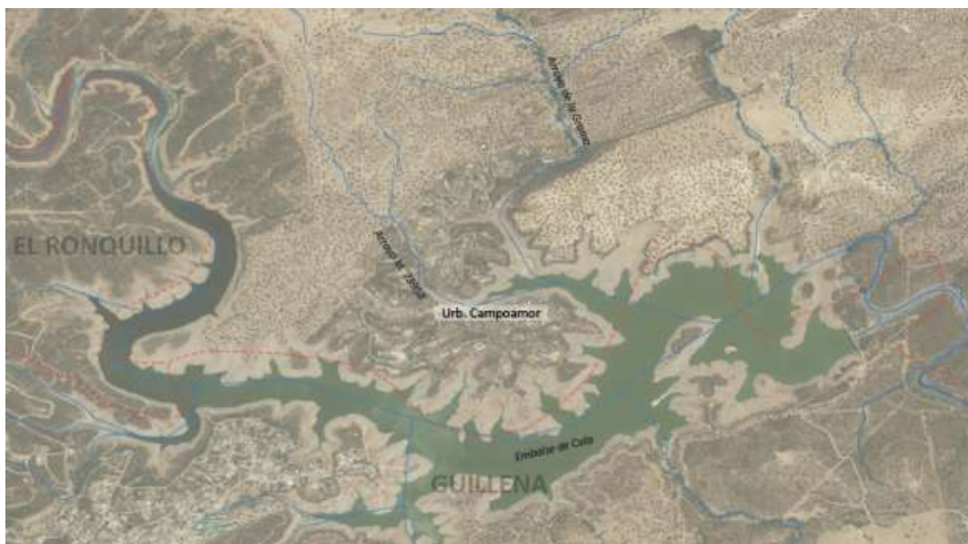
Red hidrográfica en el entorno de la urbanización Campoamor

Los principales embalses localizados en el término municipal de Castilblanco de los Arroyos son los siguientes: