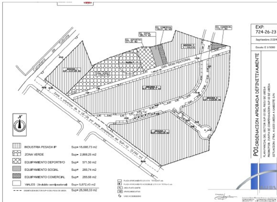
Fig.1 Situación actual del Plan Parcial SUP-10.