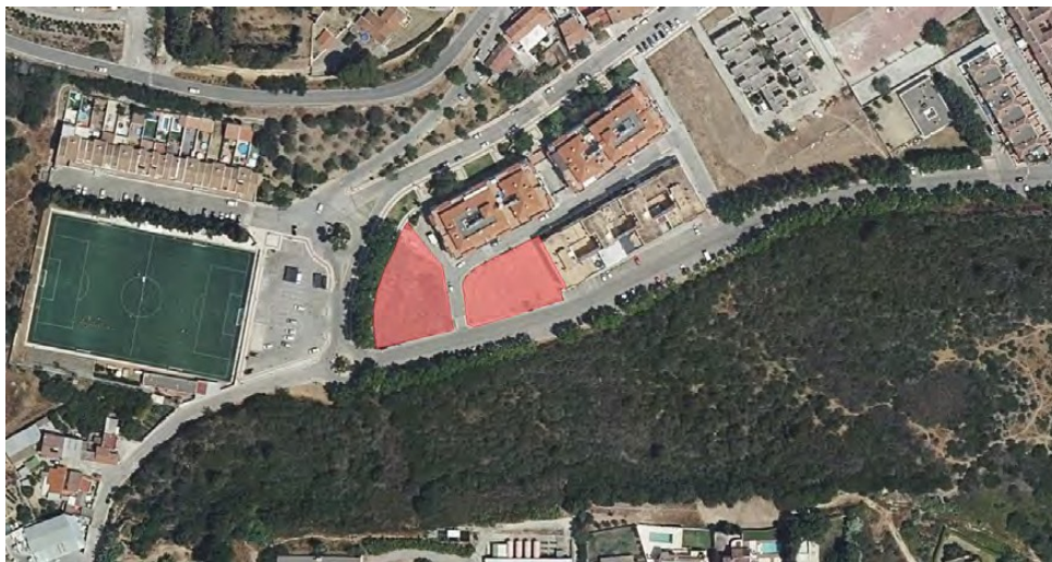
Ámbito de la actuación

La presente Modificación no realiza un cambio de uso global, el uso global es residencial, cambia parte del uso pormenorizado terciario por el uso residencial, sin incremento de aprovechamiento lucrativo ni edificabilidad, siendo una modificación de carácter puntual de la ordenación pormenorizada. Se incluye la ordenación detallada de volúmenes y determinación de alineaciones y rasantes dentro de la modificación, sin que ello signifique que no pueda ser ajustada mediante la figura del Estudio de Detalle, según lo dispuesto en el art. 15 de la LOUA.