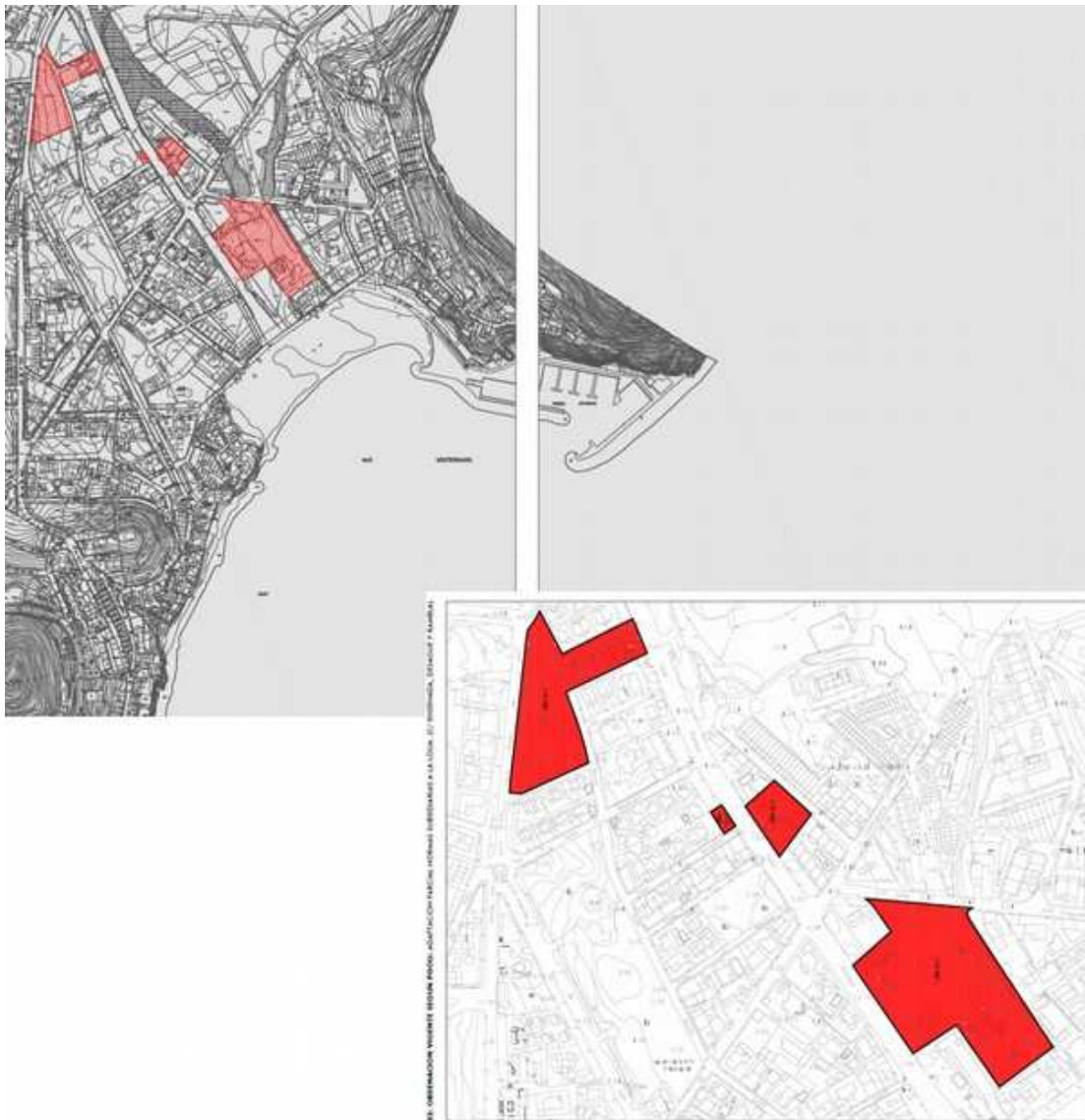
Imagen 1: Detalle del ámbito de la Innovación.

La actuación se concreta en la división de la UEA-SJ-1 en tres polígonos UEA-SJ.1.1, UEA-SJ.1.2, y UEA-SJ.1.3., con ordenación pormenorizada de UEA-SJ-1.2 y cambio de uso característico de este polígono de residencial a turístico.