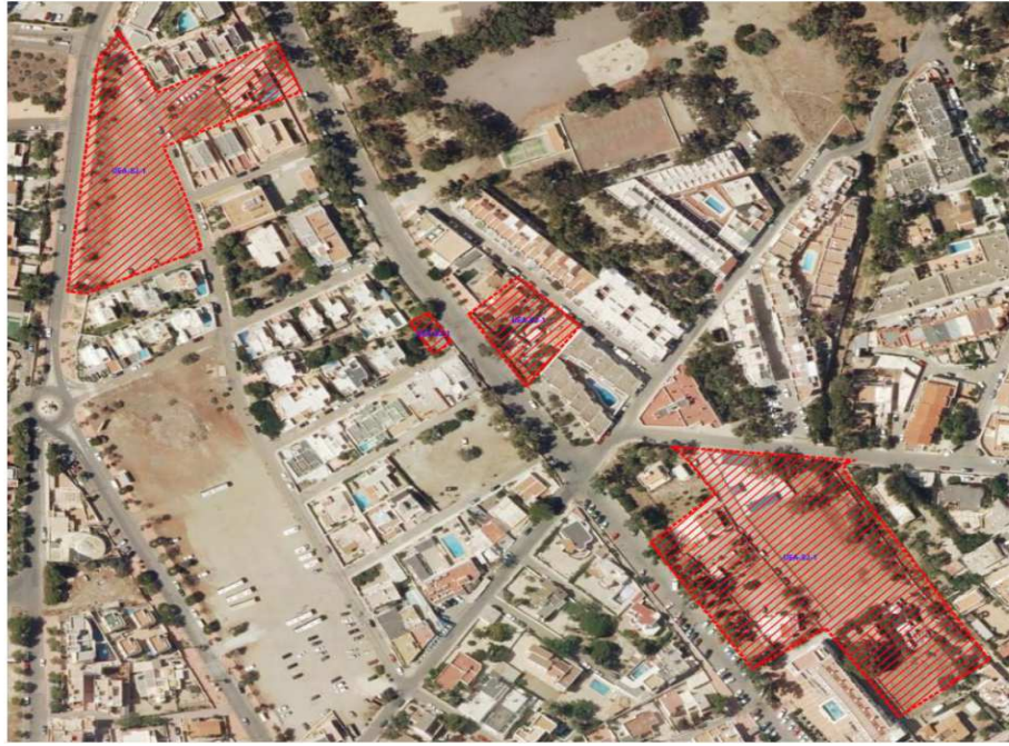
Imagen 2: Detalle del ámbito de la innovación, que se localiza en el interior del núcleo de San José (Níjar), sobre Suelo Urbano No Consolidado según el PGOU de Níjar.