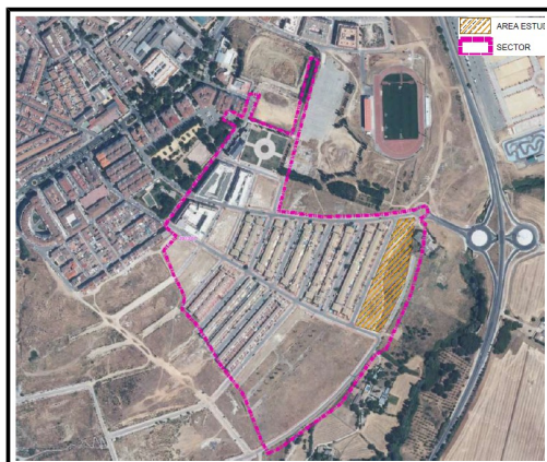
Imagen n°1 con la ubicación del ámbito de actuación.

El Plan Parcial del Sector de Ordenación SUP-E2 fue aprobado definitivamente el 30 de mayo de 2002. Con posterioridad, este plan parcial se ha visto modificado en varias ocasiones, siendo la última aprobada definitivamente en el año 2013, mediante la cual se dividía la manzana 14 en una submanzana 14.1 (Uso: Comercial. Tipología de pequeño o mediano comercio) y la 14.2.(Uso: Residencial)