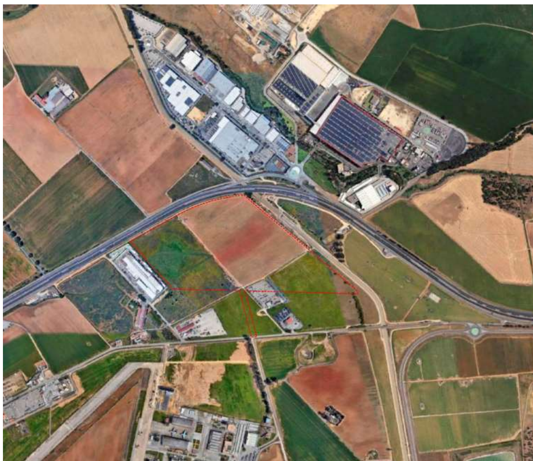
Ámbito del SUnS-3

Consultando la capa de capa de Red Hidrográfica de la Infraestructura de Datos Espaciales de la Confederación del Guadalquivir (IDE-Guadalquivir - https://idechg.chguadalquivir.es/ ), en el entorno o dentro del ámbito territorial objeto de este informe se observan los siguientes cauces, según lo definido en el artículo 2 del Texto Refundido de la Ley de Aguas, aprobado por el Real Decreto Legislativo 1/2001, donde viene contemplada la definición de dominio público hidráulico del Estado, así como a las zonas de protección asociadas de servidumbre y policía, contempladas en el art. 6 de la citada ley: