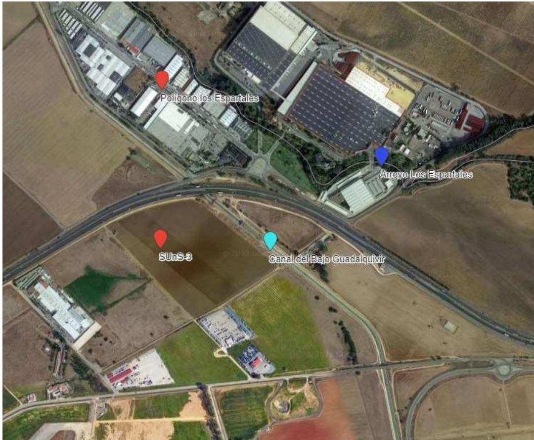
Red Hidrográfica (IDE-Guadalquivir - https://idechg.chguadalquivir.es/ ).

Consultando la cartografía de zonas inundables realizadas dentro de los trabajos del Sistema Nacional de Cartografía de Zonas Inundables (SNCZI) realizados por el MITERD, para el cumplimiento de la directiva de zonas inundables y su desarrollo en el Real Decreto 903/2010, de 9 de julio, de evaluación y gestión de riesgos de inundación, se comprueba que la zona no ha sido estudiada dentro de estos trabajos.