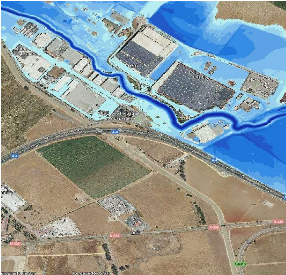
Zonas inundables. Mapa calados T500 años. (IDE-Guadalquivir - https://idechg.chguadalquivir.es/ ).

En relación a los actos y planes que las Comunidades Autónomas y las entidades locales deban aprobar en el ejercicio de sus competencias (entre las que se destaca en materia de medio ambiente, ordenación del territorio y urbanismo) y siempre que afecten al régimen y aprovechamiento de las aguas continentales o a los usos permitidos en terreno de dominio público hidráulico y en sus zonas de servidumbre y policía, el artículo 25.4 del TRLA establece que “Las Confederaciones Hidrográficas emitirán informe previo teniendo en cuenta a estos efectos lo previsto en la planificación hidráulica y en las planificaciones sectoriales aprobadas por el Gobierno”.