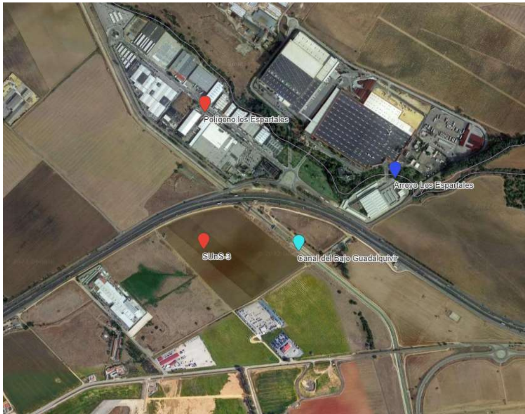
Red Hidrográfica (IDE-Guadalquivir - https://idechg.chguadalquivir.es/ ).

Consultando la cartografía de zonas inundables realizadas dentro de los trabajos del Sistema Nacional de Cartografía de Zonas Inundables (SNCZI) realizados por el MITERD, para el cumplimiento de la directiva de zonas inundables y su desarrollo en el Real Decreto 903/2010, de 9 de julio, de evaluación y gestión de riesgos de inundación, se comprueba que la zona no ha sido estudiada dentro de estos trabajos.