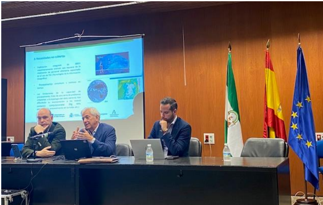
Imagen 2: Jornada de Presentación CPM AIDEA, 24 de octubre de 2023.