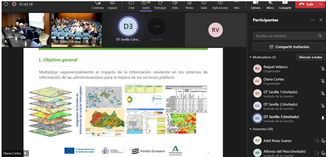
Imagen 1: Jornada de Presentación CPM AIDEA, 24 de octubre de 2023.

Para esta jornada de apertura del procedimiento se inscribieron 149 personas, de las cuales 129 personas optaron por asistir a la sesión online. Este evento supuso un primer contacto entre la entidad contratante y las empresas asistentes (Anexo IV).