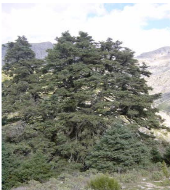
Monumento Natural Pinsapo de las Escaleretas

El riesgo de vulnerabilidad que presenta el Parque Natural frente a diversas alteraciones que se pueden producir en el mismo, según la propuesta efectuada por la Consejería de Medio Ambiente para ser declarado LIC, es bajo o muy bajo en un 96% de su superficie. Sólo en un 3% es alto o muy alto. Los principales factores de riesgo, en este sentido, son los relacionados con los procesos erosivos que, puntualmente, pueden ser graves y que están debidos a la ausencia de una cubierta vegetal protectora.