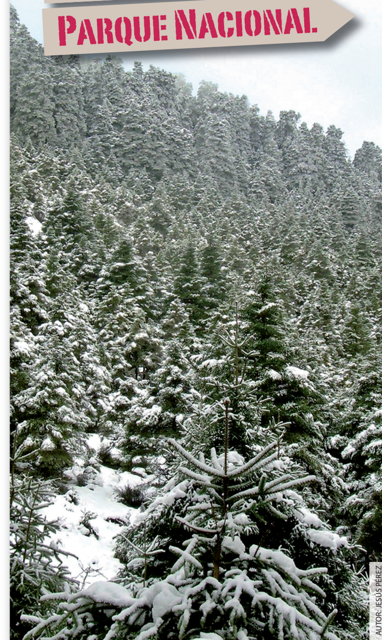
AUTOR: JESÚS PÉREZ