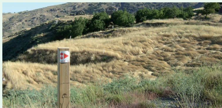
Coincidencia Ruta I con etapa 7 de Transnevada (RFM)

A partir del mirador, todo el trayecto es un descenso continuo hasta el punto de origen a través de la ladera de La Solana . Primero se cruza la Acequia de Los Hechos , que transporta agua desde la cabecera del Río Dúrcal. Un poco más abajo aparece una bifurcación, donde deberá tomar el camino de la derecha. En el siguiente cruce señalizado se continúa con un giro a la izquierda abandonando así el tramo común a Transnevada. A partir de aquí se acentúa el descenso. La vegetación es de escaso porte porque esta zona se vio afectada por un incendio en 2005. El carril puede ser algo inestable sobre todo en la parte inferior. Se suceden zonas de pastos con zonas de cultivo y algunos pinares. Grandes bloques de roca caliza flanquean el carril en el tramo final antes del cruce con el río. Tras un pequeño ascenso, de nuevo sigue el descenso entre cultivos de almendros. Quedan a la derecha grandes paredes verticales calizas y un gran desfiladero con grandes bloques rocosos que ocultan el cauce del río. Nos encontramos en la zona del Castillejo . El descenso continúa hasta nuestra incorporación junto al lecho del río. En poco tiempo, se llega al punto final de la ruta en Nigüelas .