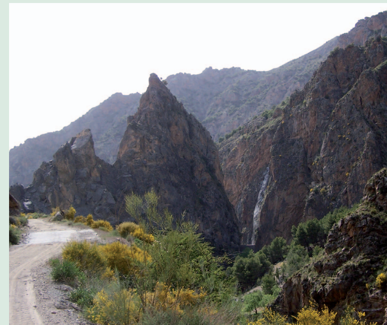
Desfiladero en el Río Torrente (TCD)

Se trata de una ruta circular que tiene inicio y fin en el pueblo de Nigüelas . Sea cual sea el sentido elegido, consta de una fase de duro ascenso y otra de descenso continuo. Ambas se realizan por las dos laderas del Río Torrente , conocidas como de la Solana, orientada al sur, y de la Umbría, orientada al norte. La parte inferior de la ruta coincide con la confluencia del Río Torrente con el pueblo de Nigüelas. En la parte superior, denominada La Rinconada de Nigüelas , quedamos a pocos metros del nacimiento de este río, en la confluencia de los barrancos de Prados de San Isidro y del Prado Largo. Ambos recogen las aguas procedentes del deshielo de la nieve acumulada en el Cerro del Caballo .