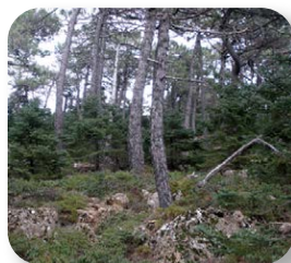
Los pinos ofrecen protección a los pequeños pinsapos

El sendero desciende suavemente a través de un pinar, donde podemos ver entremezclados muchos pinsapos de pequeño porte [2]. Este hecho muestra que el pinsapar presenta una buena regeneración en esta zona bajo la protección de los pinos. Pronto llegamos a la crestería y la cubierta arbórea desaparece [3] casi por completo. A nuestra izquierda se desarrolla el pinsapar de la Mujer, uno de los tres bosquetes de pinsapos que crecen en la sierra.