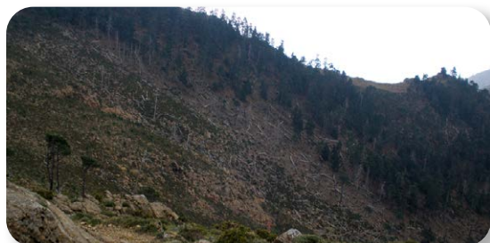
Los incendios forestales son el peor enemigo del pinsapar

El sendero desciende suavemente a través de un pinar, donde podemos ver entremezclados muchos pinsapos de pequeño porte [2]. Este hecho muestra que el pinsapar presenta una buena regeneración en esta zona bajo la protección de los pinos. Pronto llegamos a la crestería y la cubierta arbórea desaparece [3] casi por completo. A nuestra izquierda se desarrolla el pinsapar de la Mujer, uno de los tres bosquetes de pinsapos que crecen en la sierra.