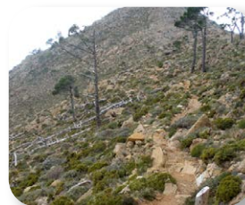
Los fuertes vientos en las crestas impiden el desarrollo de arboleda

Los incendios forestales, las plagas y otros condicionantes han dividido el pinsapar de Sierra Bermeja en tres bosques, cercanos entre sí pero con pocas posibilidades de volver a unirse: el pinsapar de la Mujer, el pinsapar de Los Reales y el pinsapar del Real Chico.