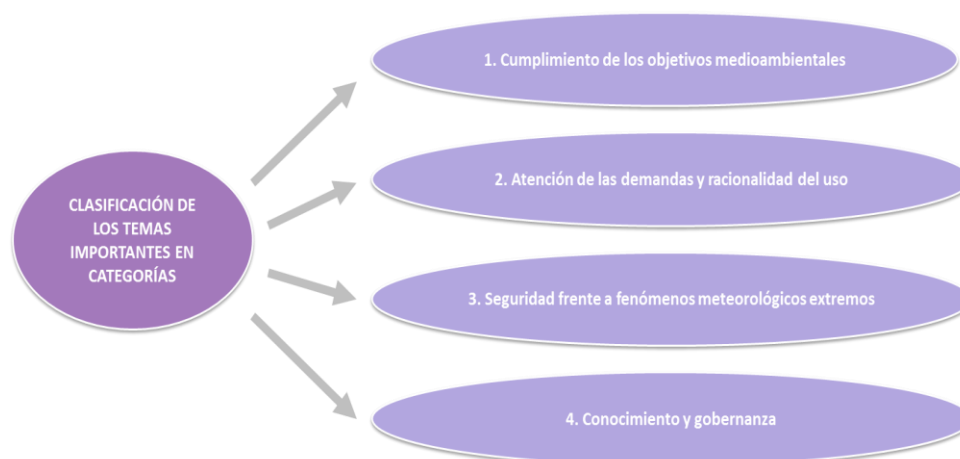
Figura nº4. Clasificación por grupos de los temas importantes

En el anterior ciclo de planificación, que ahora se revisa, se llevó a cabo una exhaustiva identificación y análisis de los temas importantes de la demarcación hidrográfica del Guadalete y Barbate. Para ello se elaboró una relación señalando de una manera ordenada todas las cuestiones o problemas que dificultaban la consecución de los objetivos de la planificación hidrológica, se valoró su importancia mediante un procedimiento semicuantitativo y se escogieron aquellos problemas que se reconocieron como más importantes o significativos. Para su identificación sistemática, los temas se agruparon en cuatro categorías: