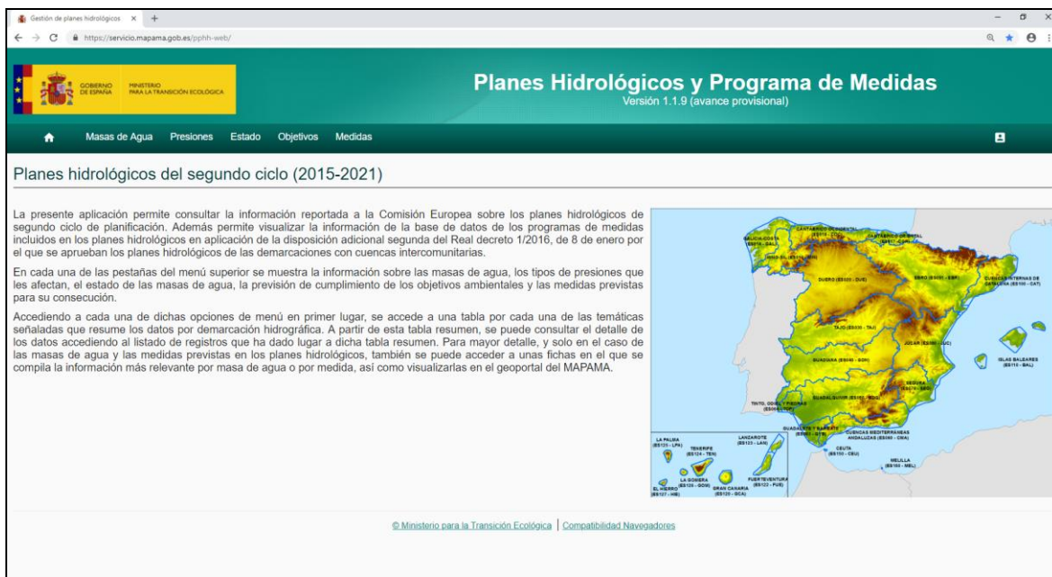
Figura nº3. Portal Web de acceso a la base de datos de planes hidrológicos y programas de medidas

La documentación del plan hidrológico y de sus programas de medidas se gestiona y almacena en la base de datos nacional que se usa, entre otras funciones, para trasladar esta información a la Comisión Europea en atención a lo indicado en el artículo 15 de la DMA.