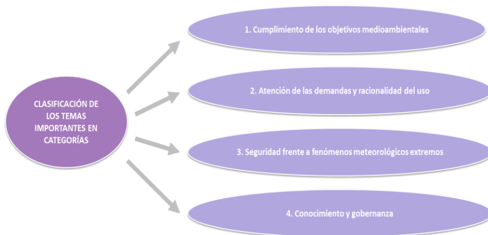
Figura nº4. Clasificación por grupos de los temas importantes

En el anterior ciclo de planificación, que ahora se revisa, se llevó a cabo una exhaustiva identificación y análisis de los temas importantes de la demarcación hidrográfica del Tinto, Odiel y Piedras. Para ello se elaboró una relación señalando de una manera ordenada todas las cuestiones o problemas que dificultaban la consecución de los objetivos de la planificación hidrológica, se valoró su importancia mediante un procedimiento semicuantitativo y se escogieron aquellos problemas que se reconocieron como más importantes o significativos. Para su identificación sistemática, los temas se agruparon en cuatro categorías: