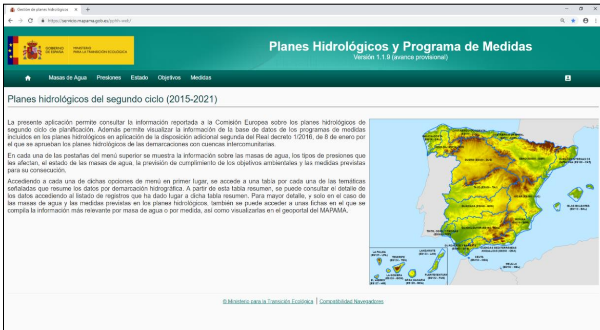
Figura nº3. Portal Web de acceso a la base de datos de planes hidrológicos y programas de medidas.

La documentación del plan vigente y de sus programas de medidas se gestiona y almacena en la base de datos nacional que se usa, entre otras funciones, para trasladar esta información a la Comisión Europea en atención a lo indicado en el artículo 15 de la DMA.