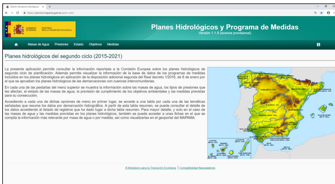
Figura nº3. Portal Web de acceso a la base de datos de planes hidrológicos y programas de medidas.

La documentación del plan vigente y de sus programas de medidas se gestiona y almacena en la base de datos nacional que se usa, entre otras funciones, para trasladar esta información a la Comisión Europea en atención a lo indicado en el artículo 15 de la DMA.