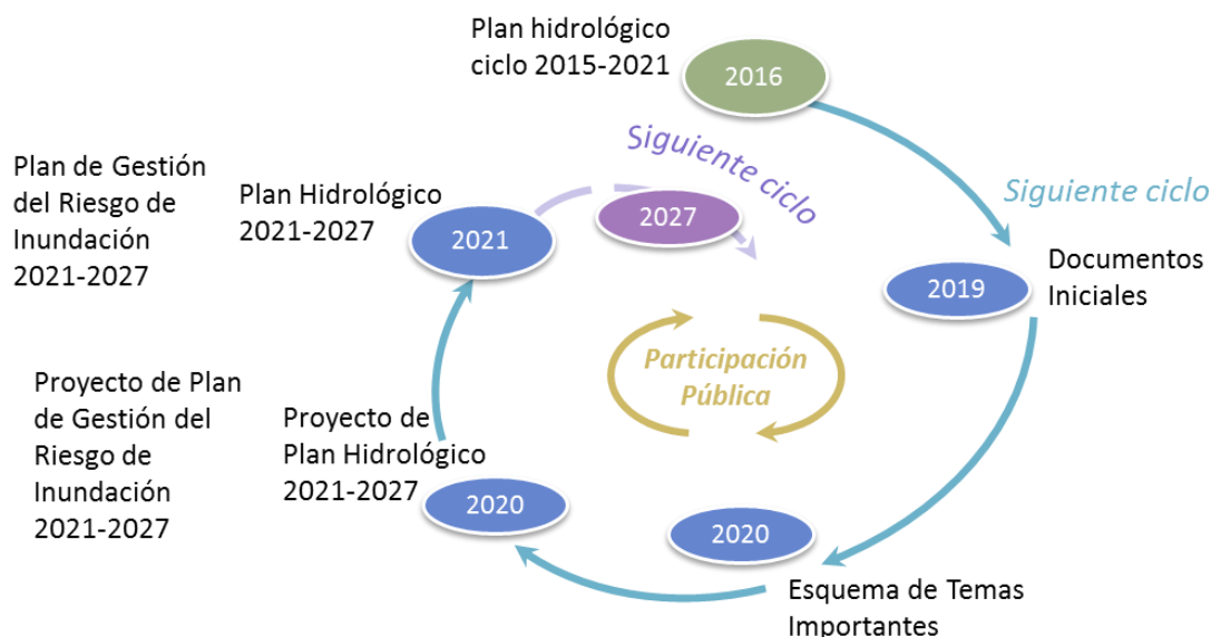
Figura nº1. Ciclos iterativos de planificación hidrológica

El procedimiento de elaboración de los planes hidrológicos ha de seguir una serie de pasos establecidos por disposiciones normativas. Uno de los elementos importantes en el proceso de planificación, tal y como éste se contempla desde la entrada en vigor de la Directiva Marco del Agua de la Unión Europea (DMA), es la elaboración de un Esquema de Temas Importantes de la Demarcación (en adelante ETI), cuyo documento provisional correspondiente al tercer ciclo de planificación (2021-2027) aquí se presenta.