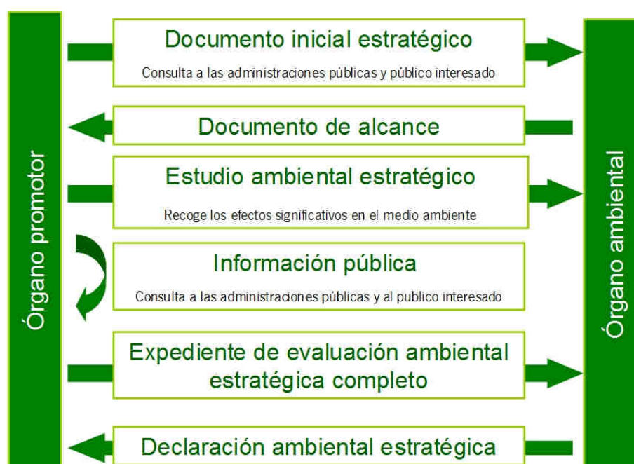
Interacción y fases del proceso de Evaluación Ambiental

La versión preliminar del II Plan de Desarrollo y el Estudio Ambiental Estratégico se someterán, durante un plazo mínimo de 45 días, a información pública. Una vez finalizada la fase de información pública y de consultas y tomando en consideración las alegaciones formuladas durante las mismas, se modificará el Estudio Ambiental Estratégico y se elaborará la propuesta final del II Plan de Desarrollo Sostenible, que formarán el Expediente de Evaluación Ambiental, remitiéndose al órgano ambiental para que éste formule la Declaración Ambiental Estratégica, el cual se incorporará a la versión final del II Plan de Desarrollo Sostenible.