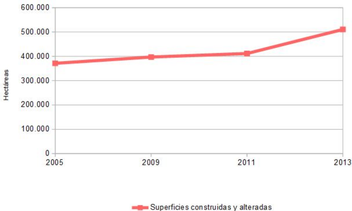
Evolución de la ocupación del suelo en Andalucía, SIOSE 2005-2013