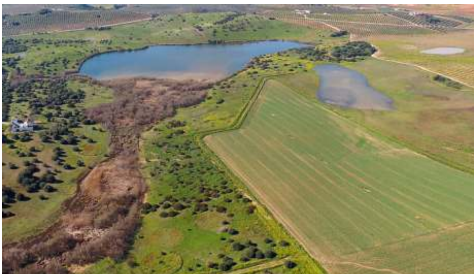
Laguna de Tíscar. Autor: Juan de la Cruz Merino