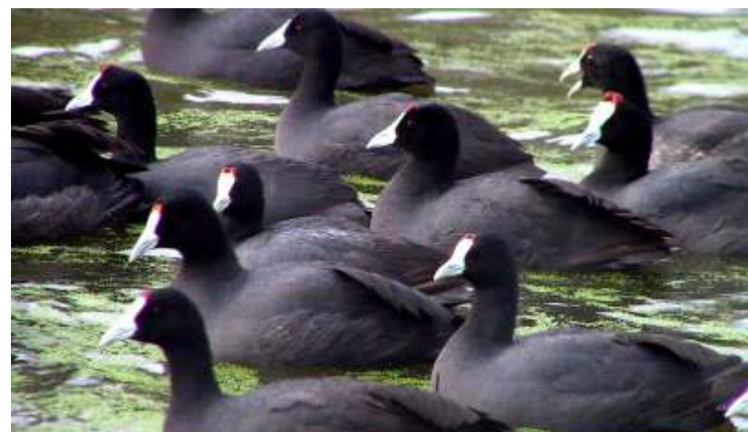
Focha moruna ( Fulica cristata ).