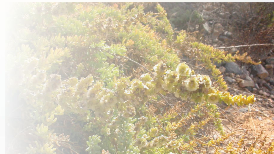
Salsola Papillosa . Autor: Hedwing Schwarzer