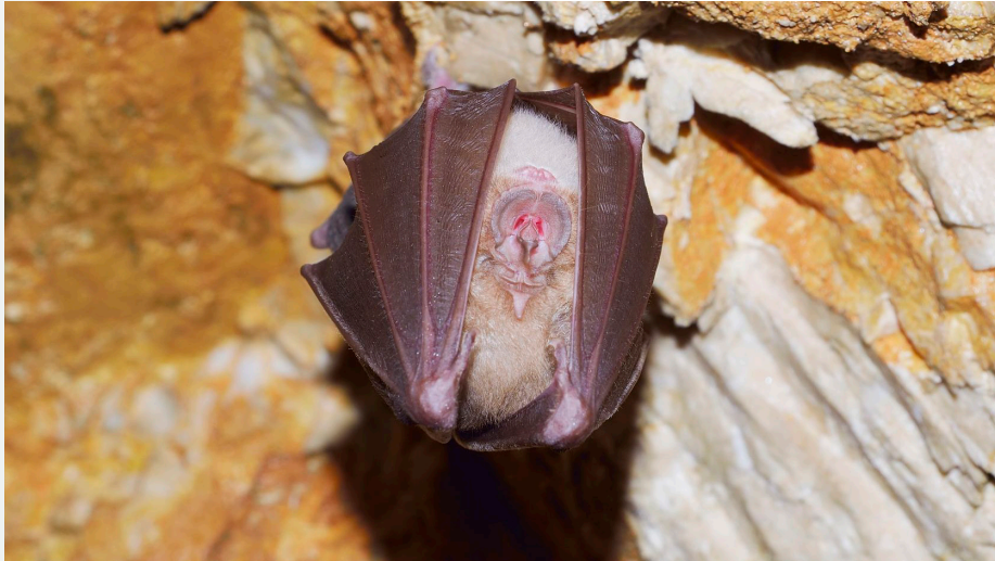
Murciélago pequeño de herradura ( Rhinolophus hipposideros).