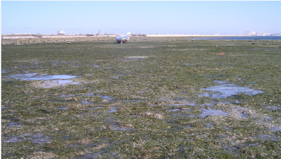
Pradera de Zostera noltei en bajamar.