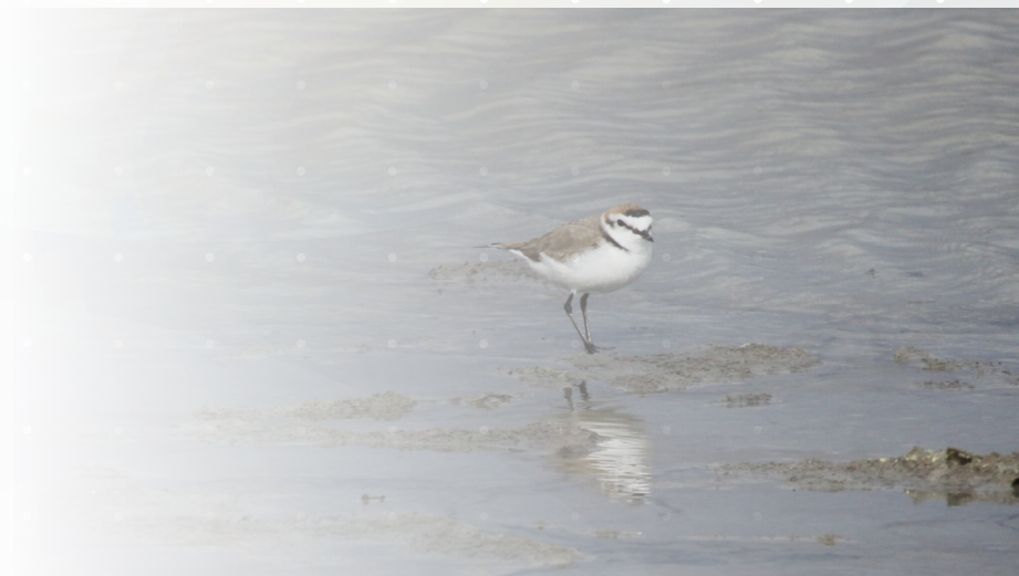
Chorlitejo patinegro ( Charadrius alexandrinus ). Autor: Juan Luis González