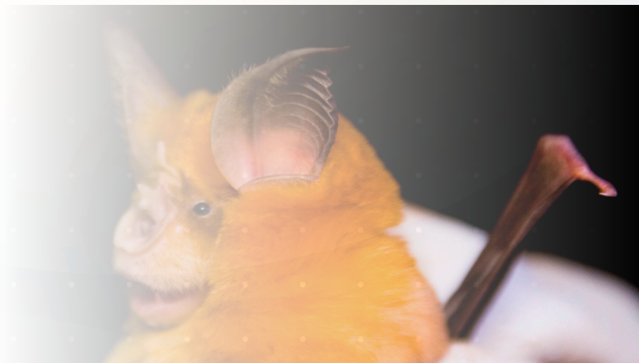
Murciélago mediano de herradura ( Rhinolophus mehelyi ).