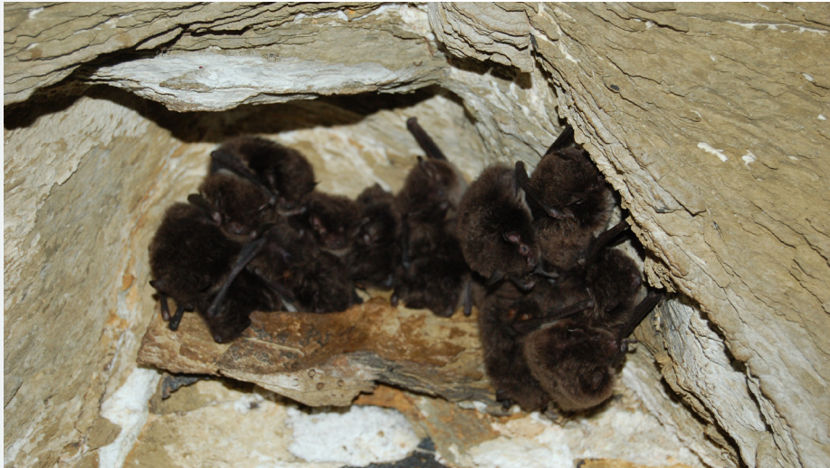
Murciélago de ribera ( Myotis daubentonii ). Autor: José Manuel Méndez