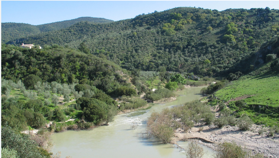
Curso alto del río Guadalete.